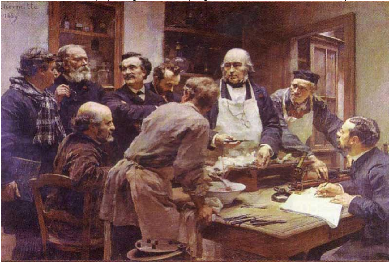
Claude Bernard et ses disciples

Ses travaux abordent des sujets aussi variés que l'action vasomotrice du système nerveux sympathique, la production de la chaleur animale, le mode d'action de l'oxyde de carbone sur l'hémoglobine du sang, le problème de l'asphyxie, les effets du curare à partir de flèches empoisonnées rapportées d'Amérique du Sud, l'étude des anesthésiques, le diabète... Pour Claude Bernard : « Le connu perd son attrait... L'inconnu est plein de charme ». Aussi les découvertes succèdent-elles aux découvertes. La physiologie fait des progrès considérables sous son impulsion.