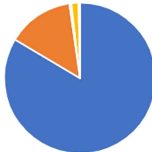
« Répartition par grade »

■ Chevalier (549) ■ Officier (93) ■ Grand Officier (3) ■ Commandeur (10) ■ Grand' Croix (2)