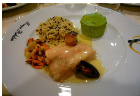
Un « échantillon » des convives et des excellents mets confectionnés et servis par les élèves du Lycée encadrés par leurs Professeurs.

Texte Anne-Marie Bacic