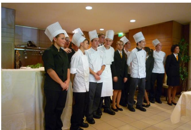
Le Proviseur et ses élèves