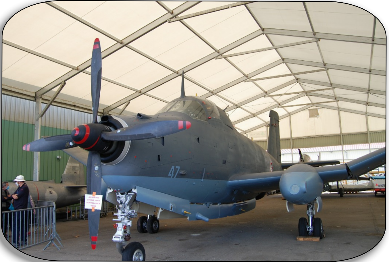
Le Breguet BR1050 N° 47 Alizé avion de lutte anti-sous-marine