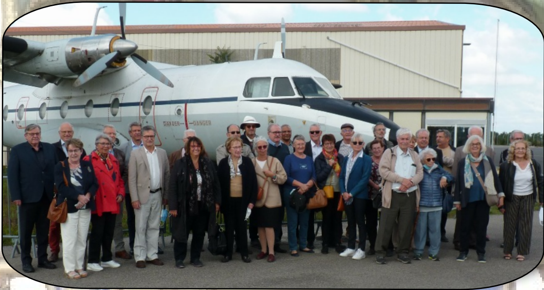
Les visiteurs devant le N 262 Frégate N° 60 de la marine

VISITE DU MUSÉE DE L'AVIATION LYON - CORBAS