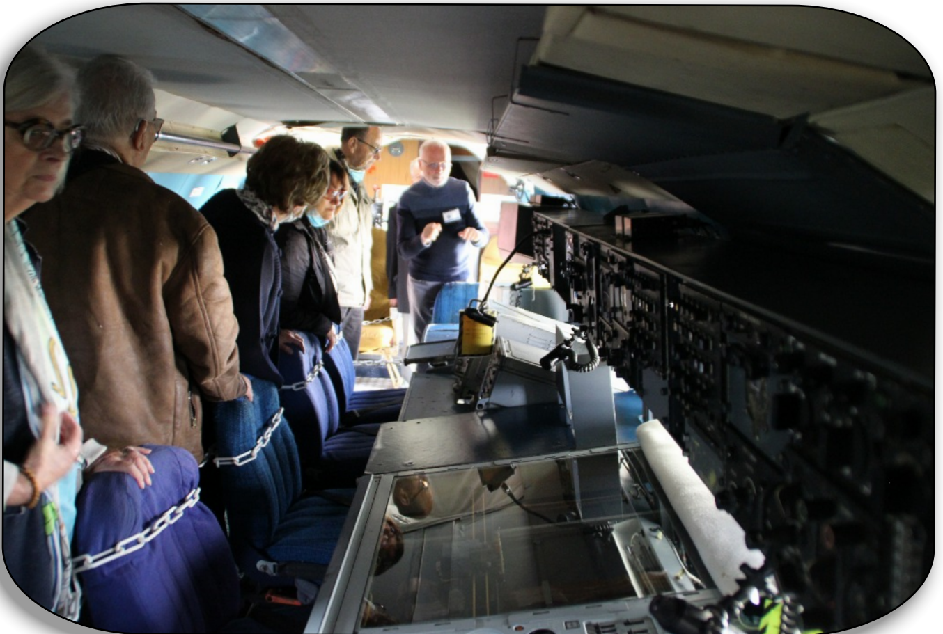
L'intérieur du N 262 Frégate N° 60 de la marine, les visiteurs sont déçus, ils pensaient faire un petit tour, mais ce n'est pas la version transport de personnel, pour cela il faut s'adresser à l'armée de l'air !