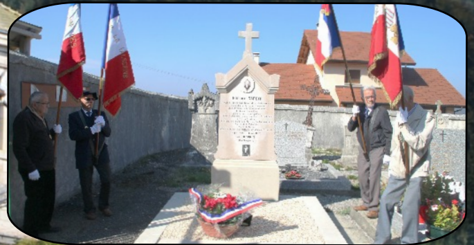
La cérémonie au cimetière