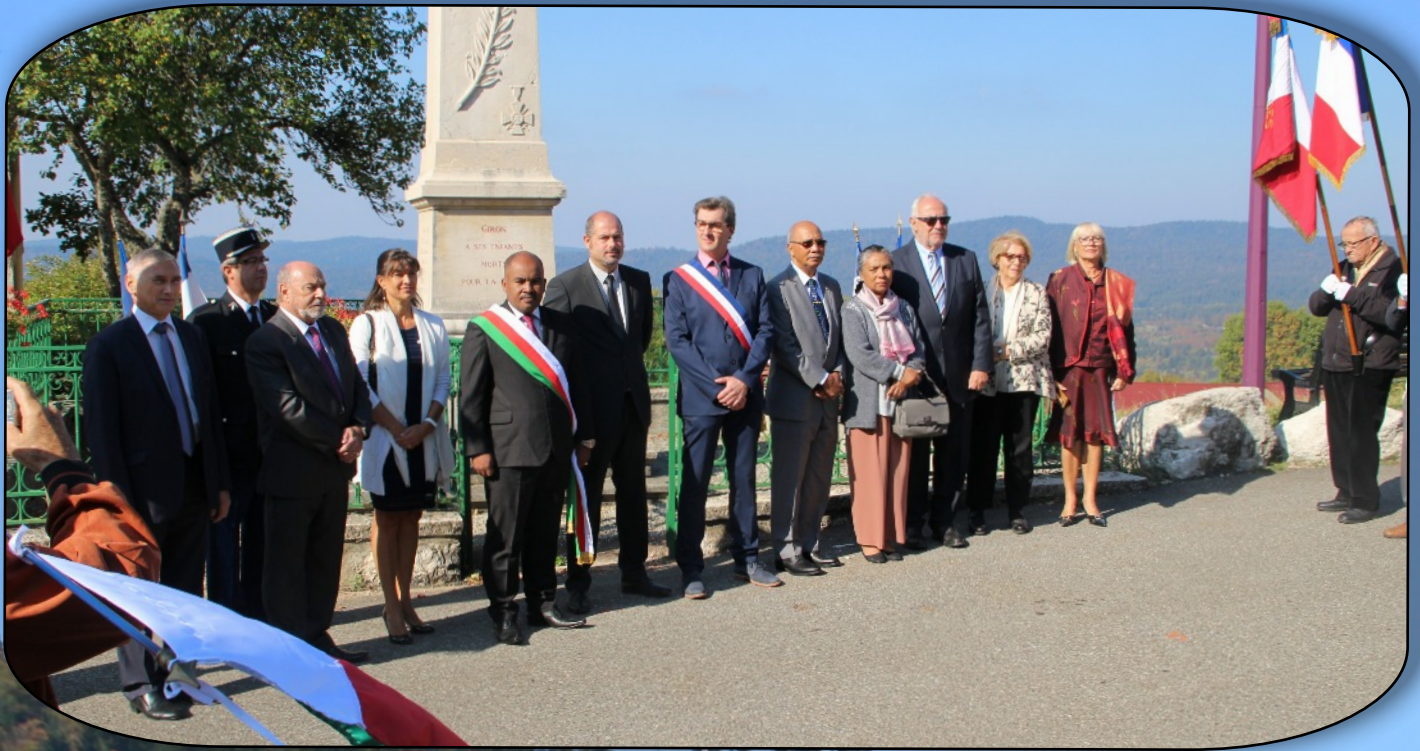
Les autorités après la cérémonie au monument aux morts