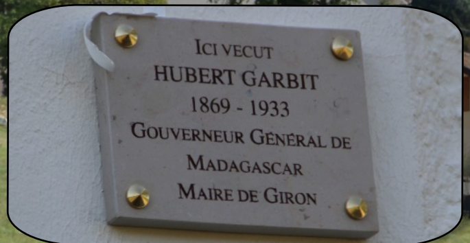
La plaque commémorative