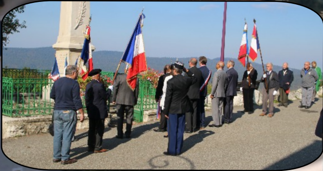
La cérémonie au monument aux morts