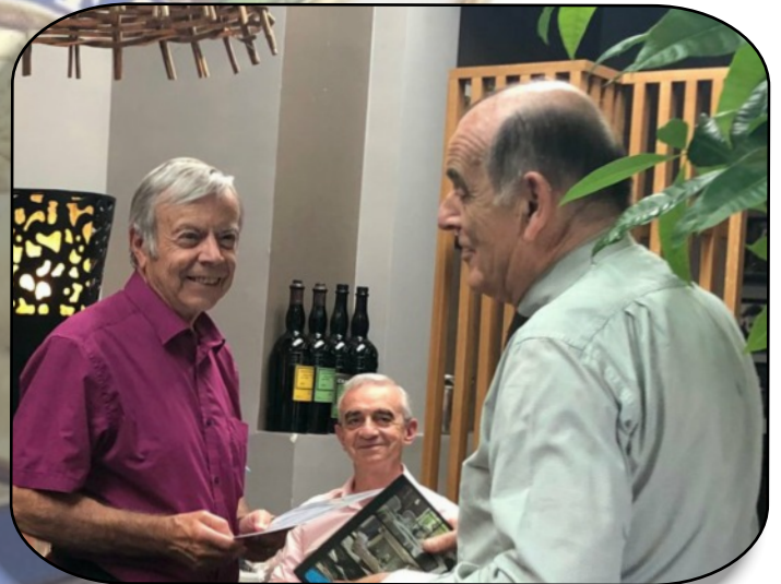
Au référent communication