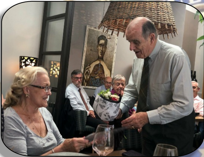
A la trésorière adjointe