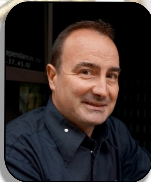
Chacun est reparti avec « ma cuisine sans échec » signé Fabrice BONNOT