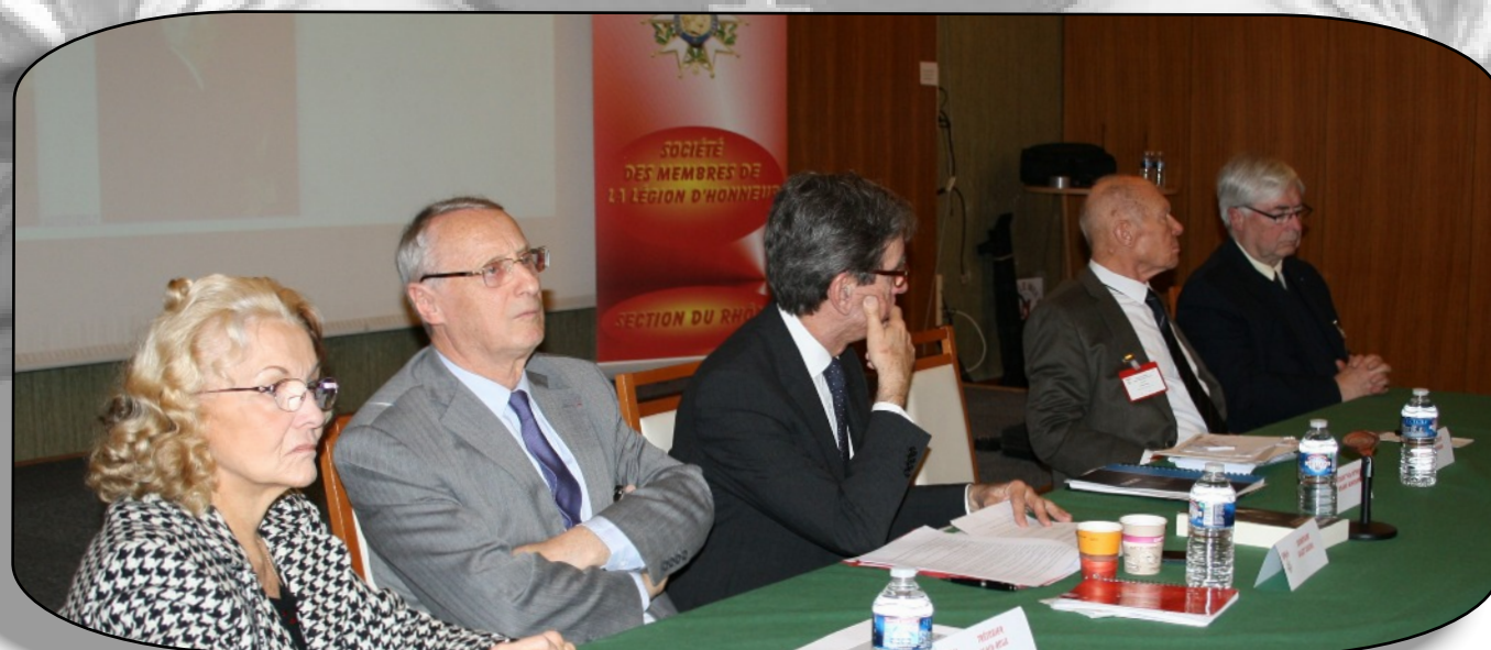
Une partie de l'ancien bureau de la Section