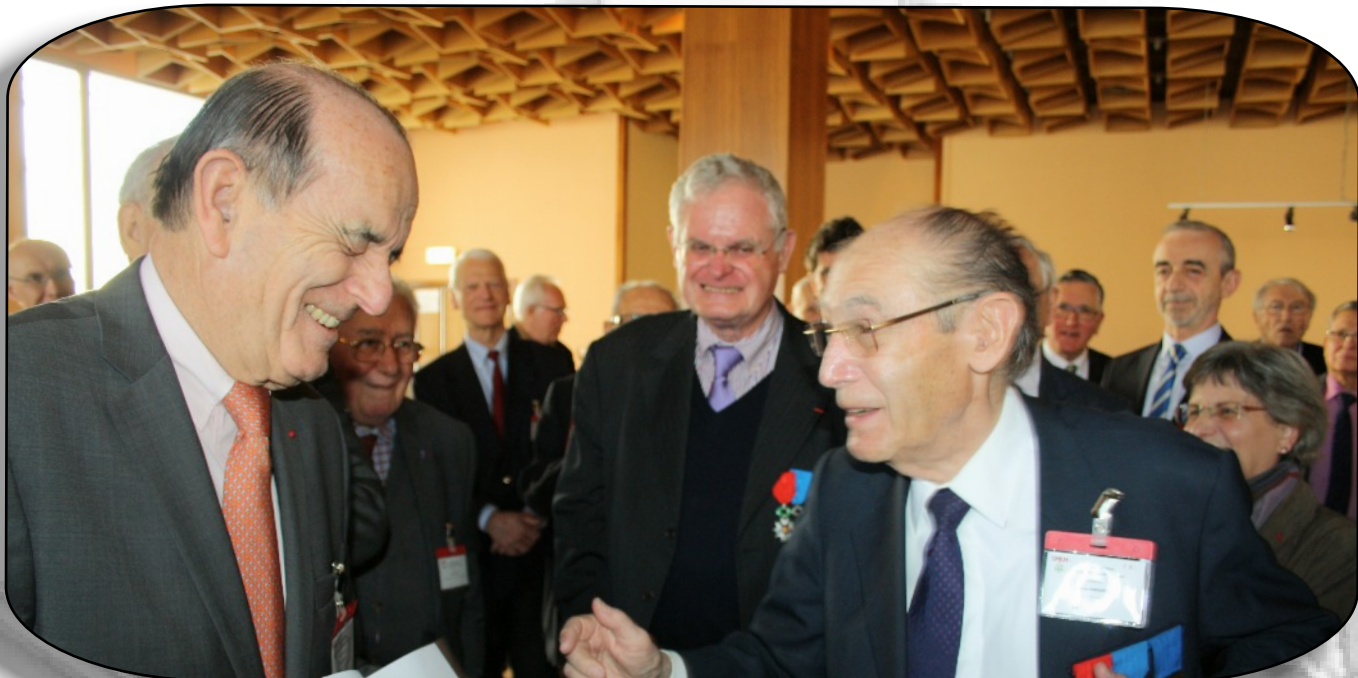
Un nouveau président, un président honoraire et un nouveau secrétaire heureux !