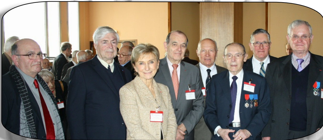
Une partie du nouveau bureau de la Section