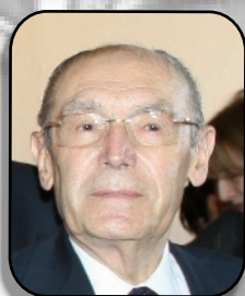
L'ancien et le nouveau Président