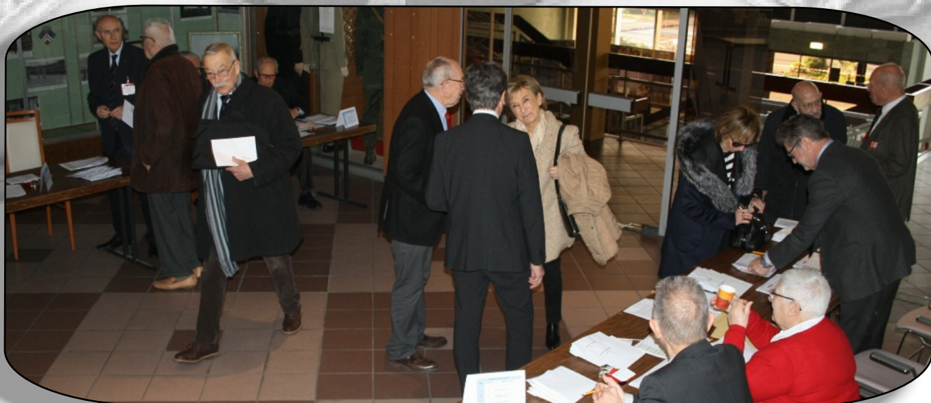
Un grand merci aux sociétaires volontaires qui sont venu la veille pour préparer le déroulement de cette assemblée et qui ont armé dès 8 heures, le jour « J » les bureaux d'accueil, devenus ensuite bureaux de vote.