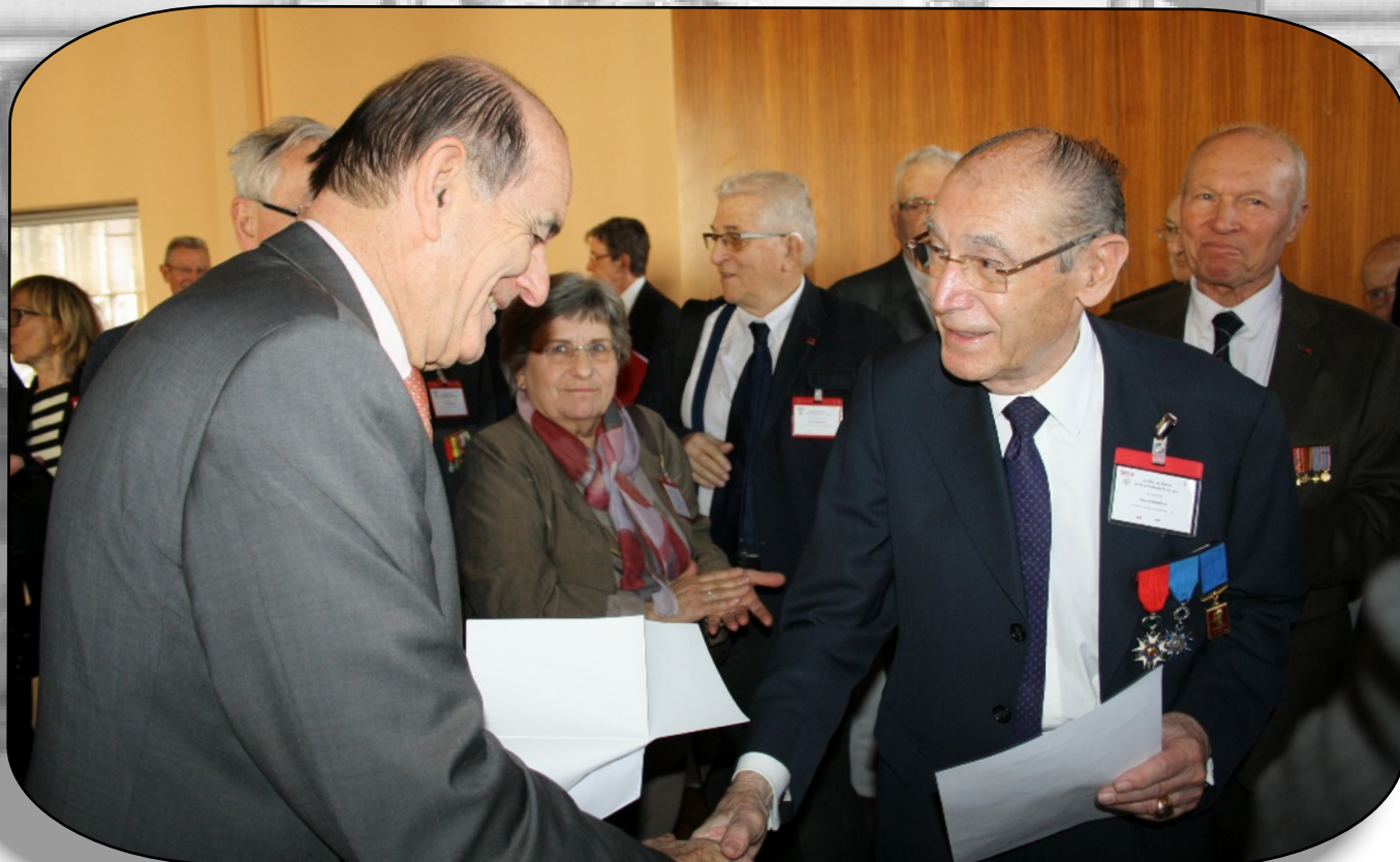
Passation de témoin entre ancien et nouveau président