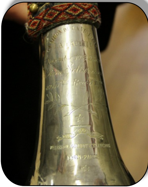
Le Clairon de la Victoire