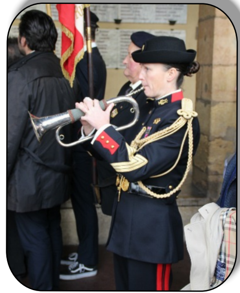
Sonnerie du « Cessez le feu » Qui annonce l'Armistice.