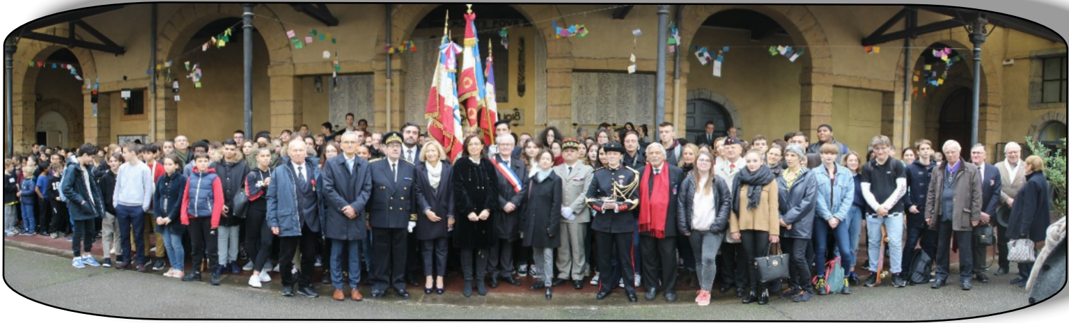
Les élèves encadrent les autorités

L'hommage rendu aux nombreux anciens de ce Lycée qui ont donné leur vie durant la Grande Guerre.