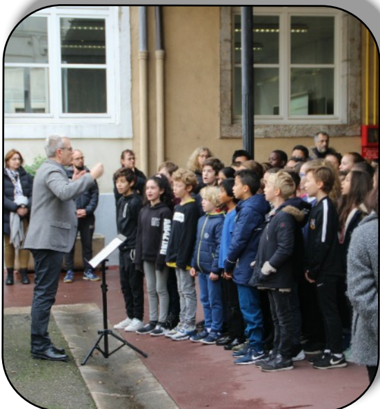
La jeune génération participe aussi à la cérémonie