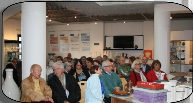
Les élèves sont attentifs