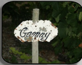
Du gamay, on est pourtant pas en beaujolais !