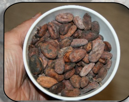
« fèves de cacao » après torréfaction