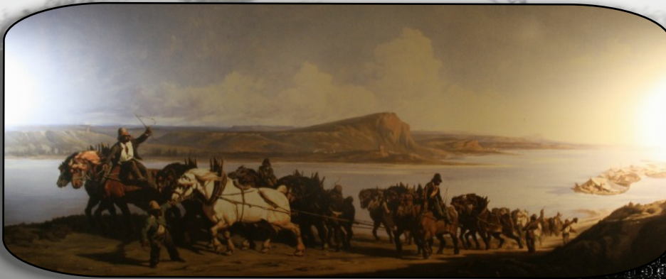
Avant l'invention de la vapeur

Puis la RN 88 par la rive droite du Rhône, en traversant la cité historique de Tournon, nous fait découvrir la troisième spécificité locale à la « maison du vin de Saint Désirat » qui produit le réputé « Saint-Joseph ». Une pause à Tournon a été l'occasion de découvrir quelques hommes qui se sont illustrés dans l'histoire du Lycée de cette ville.