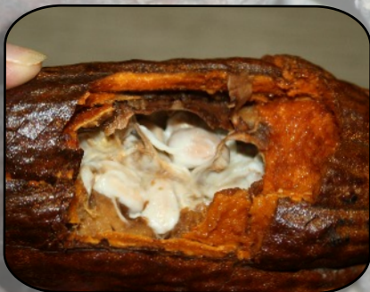
Cabosse préparée par Geneviève