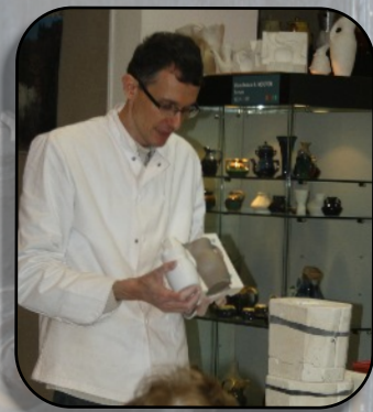
Naissance d'un pichet