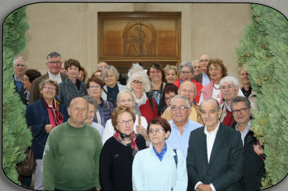
Le cadre de verdure limite la photo de famille !