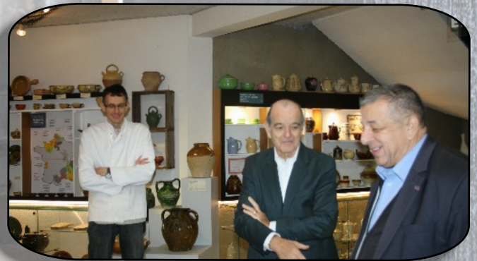
Alors que le Président local de la SMLH nous accueille