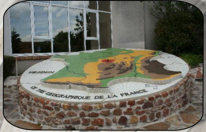
VESDUN EN BERRY

Après le déjeuner pris à proximité, à VESDUN EN BERRY , une des communes qui prétend être le centre géographique de la France.