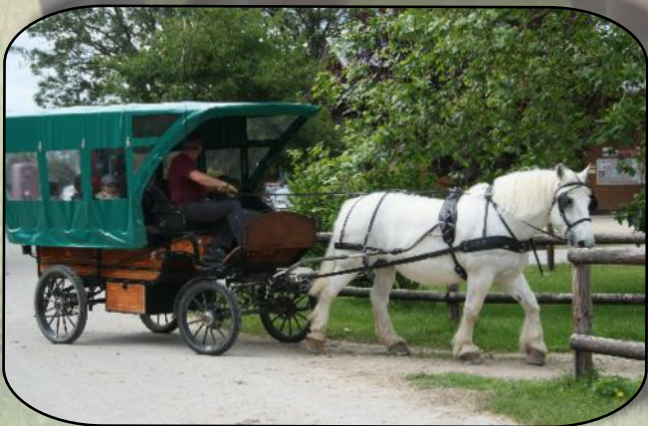
Pas pour nous