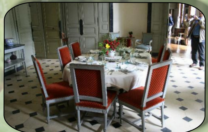
La salle à manger