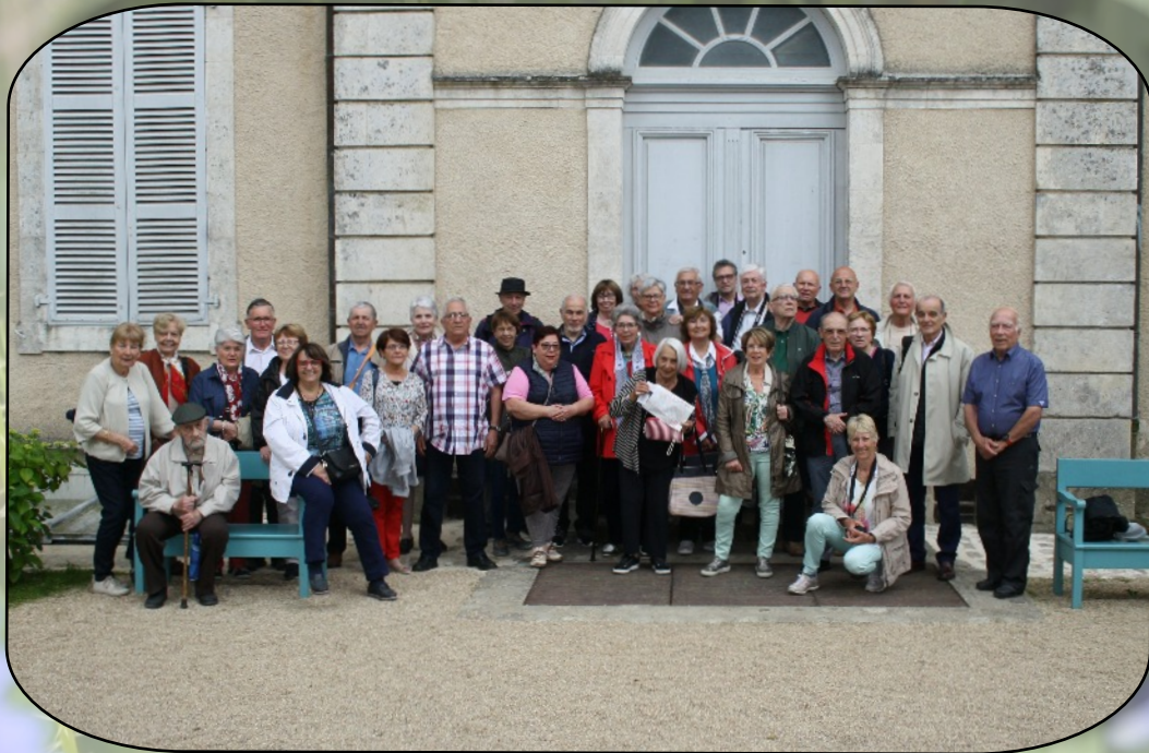
Les voyageurs devant la maison de George Sand

L'après-midi a permis à chacun de s'immerger dans les paysages de George Sand (maison et dépendances, mare au diable, fresques de Vic, Saint-Chartier).