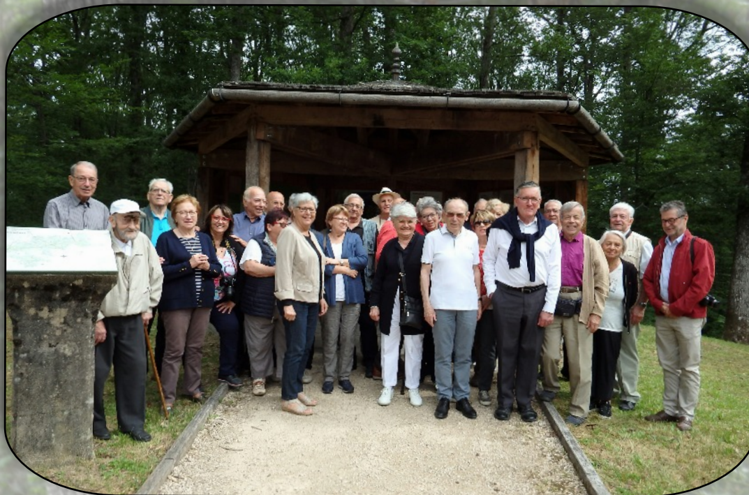
Voyageurs en forêt

Après l'acier et le verre, cap sur le bois à " la Forêt de Tronçais " .