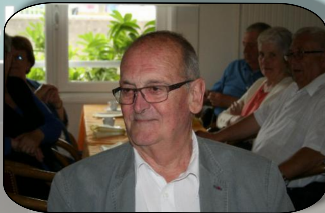
Le Président du comité de La Chatre