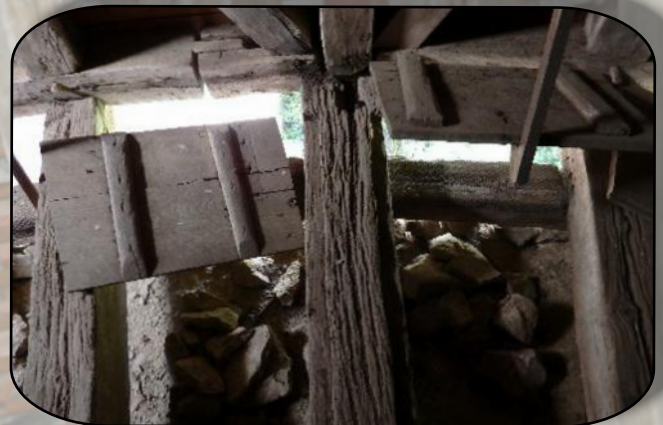
Les hours permettent de lancer divers projectiles sur les assaillants, une particularité que l'on retrouve au château des Tours à Anse

De là direction LA CHATRE , où nous résidons pour deux nuitées à l'hôtel du Lion d'Argent et des tanneries, qui dispose d'un agréable jardin privé bordé par l'Indre.