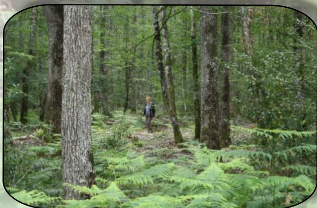
On a failli perdre une participante