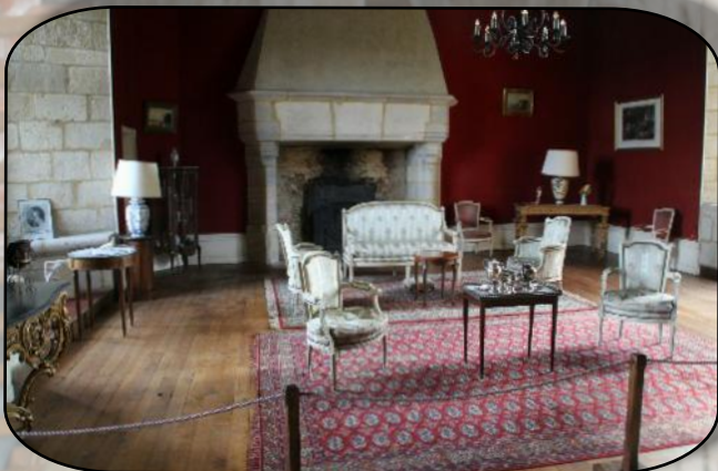
Et celui des seigneurs

De là direction LA CHATRE , où nous résidons pour deux nuitées à l'hôtel du Lion d'Argent et des tanneries, qui dispose d'un agréable jardin privé bordé par l'Indre.