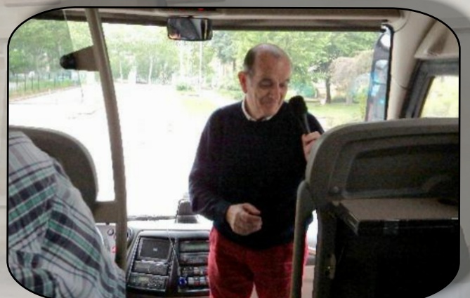
Le Président ordonne « Clap de fin »

Comme à l'accoutumée des explications de natures diverses nous ont été délivrées tout au long du parcours par l'équipe des organisateurs.