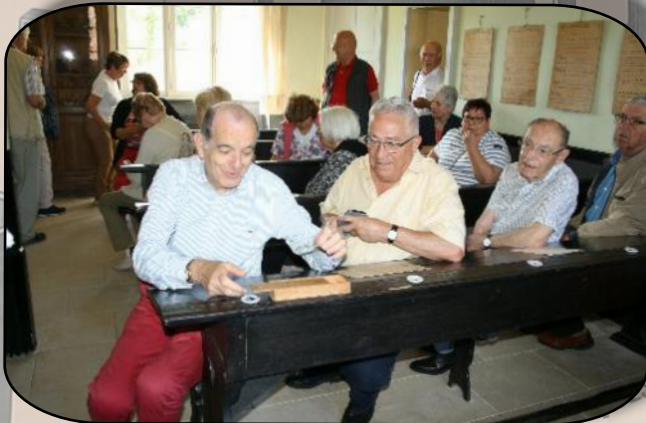
Le Président a repris la plume sergent major

Rédaction Un de vos camarades prétend que les gendarmes, le garde-champêtre, mènent une vie oisive. Énumérez les services que rendent ces braves gens à la commune, au canton et à la France.