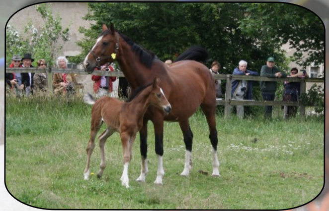
Que de spectateurs !