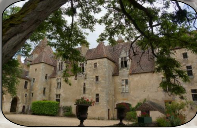
forteresse médiévale de Culan

Nous découvrons CULAN dans l'Indre pour visiter sa " forteresse médiévale ".