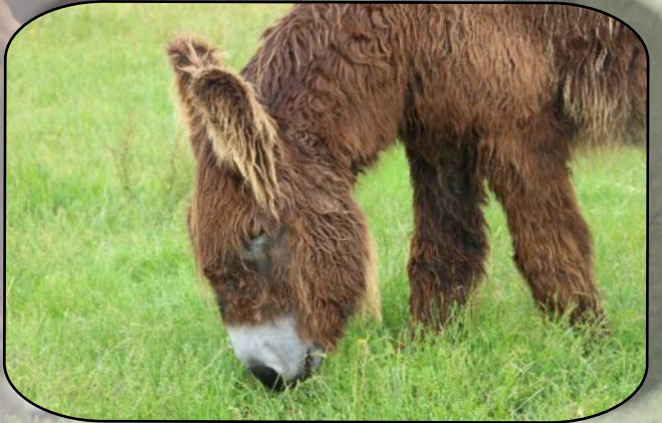
On a volé ma tondeuse