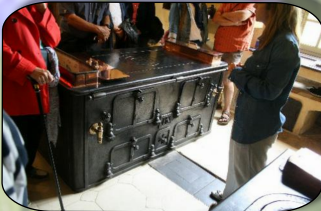
Le piano de la cuisine