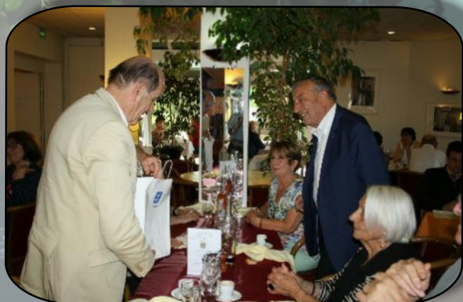
Les deux présidents de section