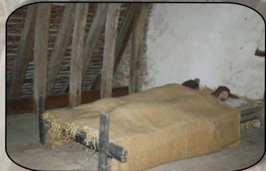
Le confort des guerriers