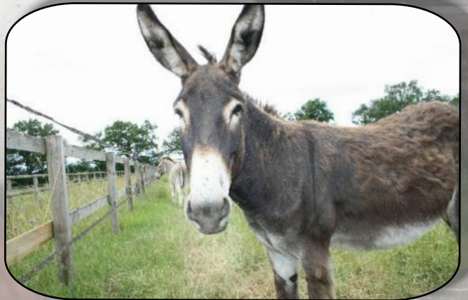
Oui je suis beau !