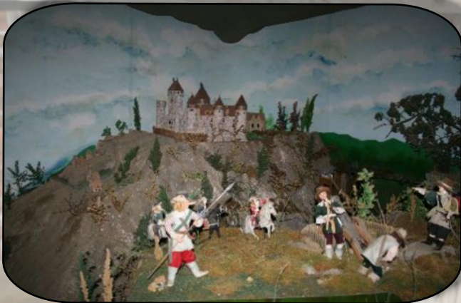
Une scène du moyen-âge