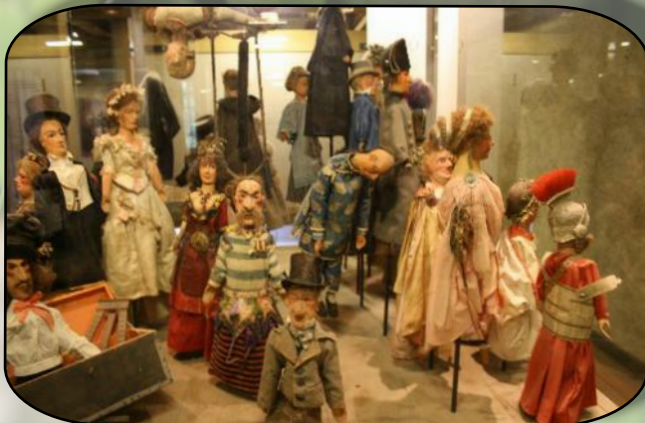
Quelques personnages du petit théâtre