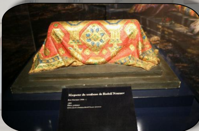
Maquette du tombeau de Rudolf Noureev