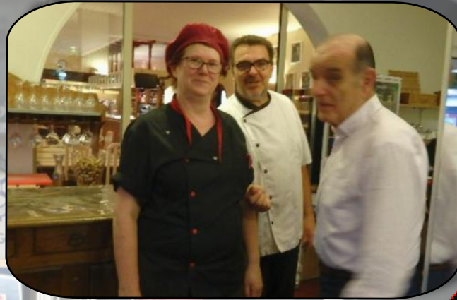
L'équipe qui nous a préparé d'excellents repas