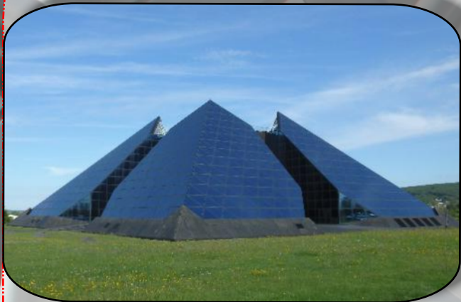
Une construction futuriste

La visite prévue à " La Cité de l'Or " n'a pas pu se dérouler pour cause de cambriolage, nous avons tout de même pu profiter de ce magnifique bâtiment plutôt sous employé !