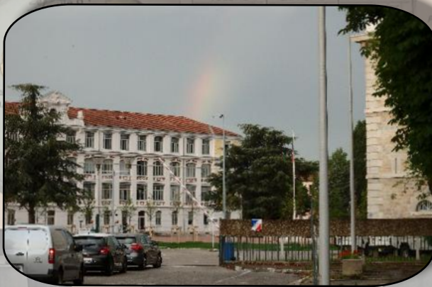
Les organisateurs avaient même programmé un arc en ciel !

En partant du Quartier Général Frère notre car a pris la direction du nord - ouest. Une pose technique avant Clermont-Ferrand, a permis à chacun de se dégourdir les jambes !