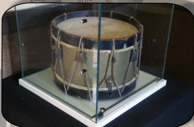
Le tambour du Garde-Champêtre