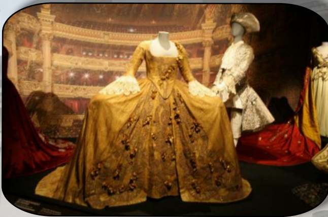
Des milliers de costumes