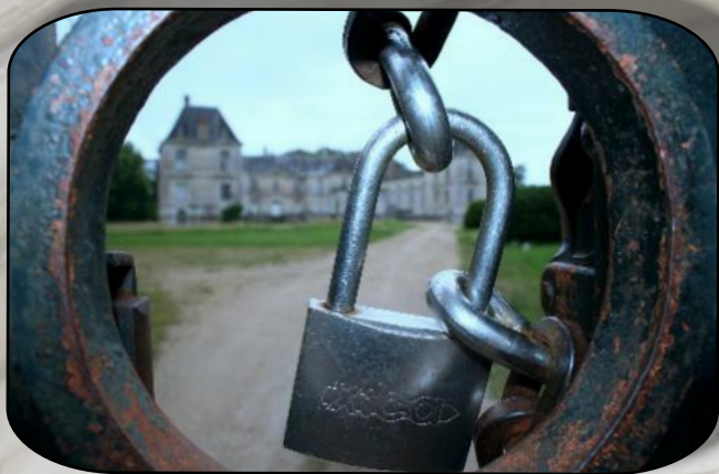
Le château de Lignières bien protégé

Après le petit-déjeuner, départ pour LIGNIERES . Découverte de la ville, de l'église Notre Dame, ainsi que des extérieurs du château.