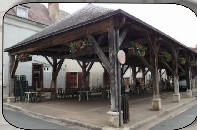
Les halles de Lignières