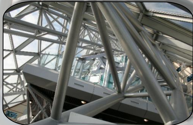
Un entrelacement de tubes