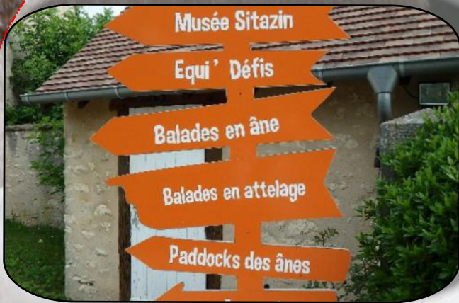
L'embarras du choix

En fin de matinée visite du " Pôle du Cheval et de l'Âne " et du "Musée Sitazin ".