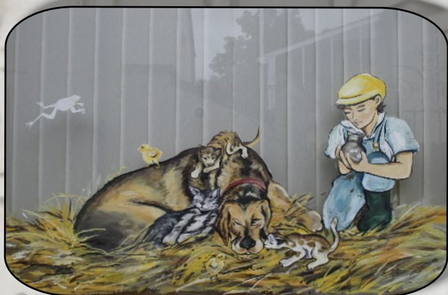
A Lignières les animaux sont rois