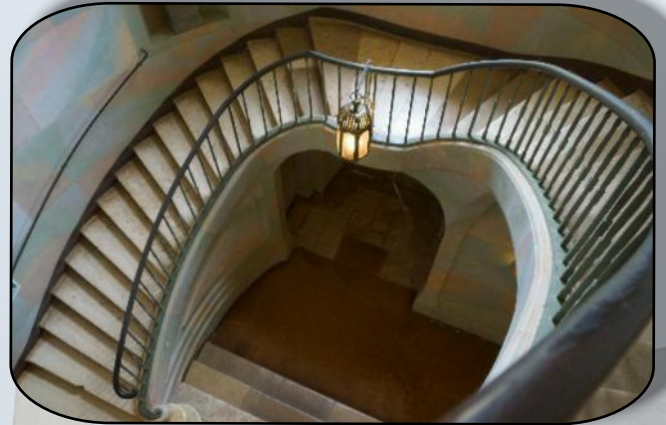
L'escalier monumental sauvé in entremis