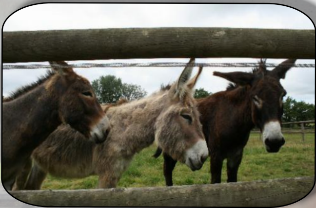
Les spectateurs ont changé de coté