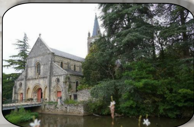
L'église Notre Dame