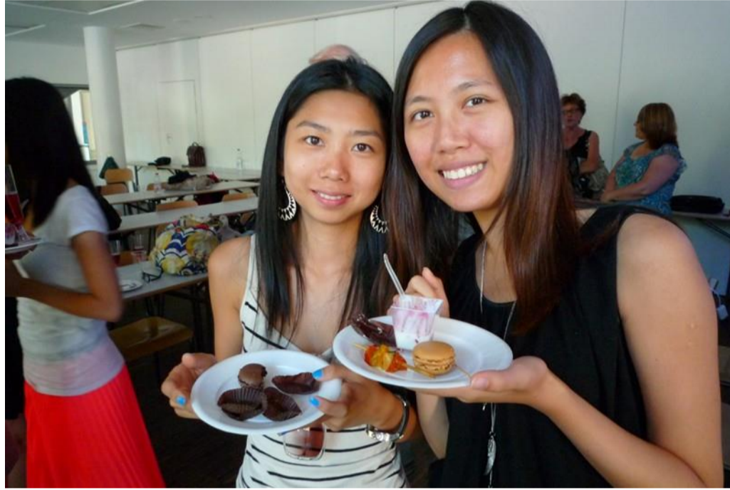
Comme le 5 juillet, La cuisine française est toujours appréciée.