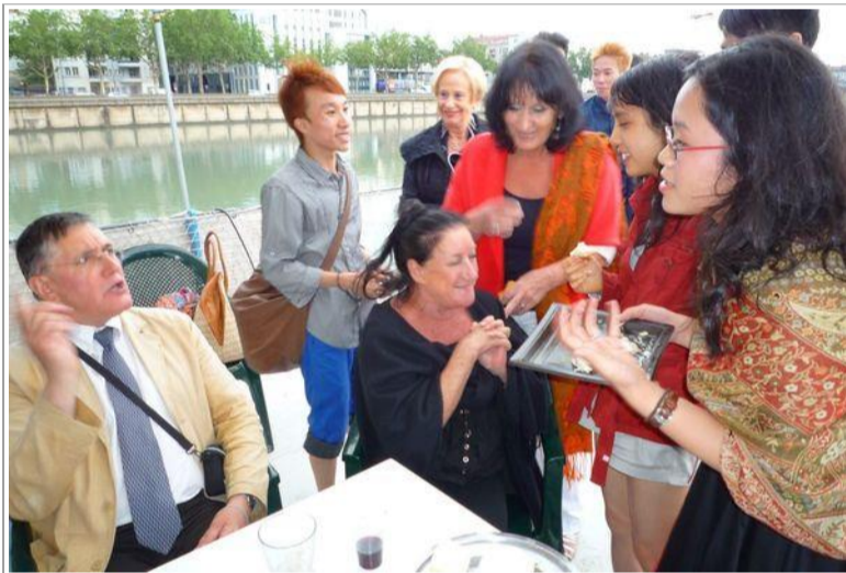
La bonne humeur règne.