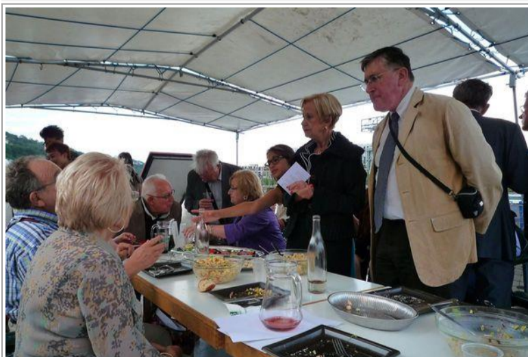
La cuisine française est appréciée.