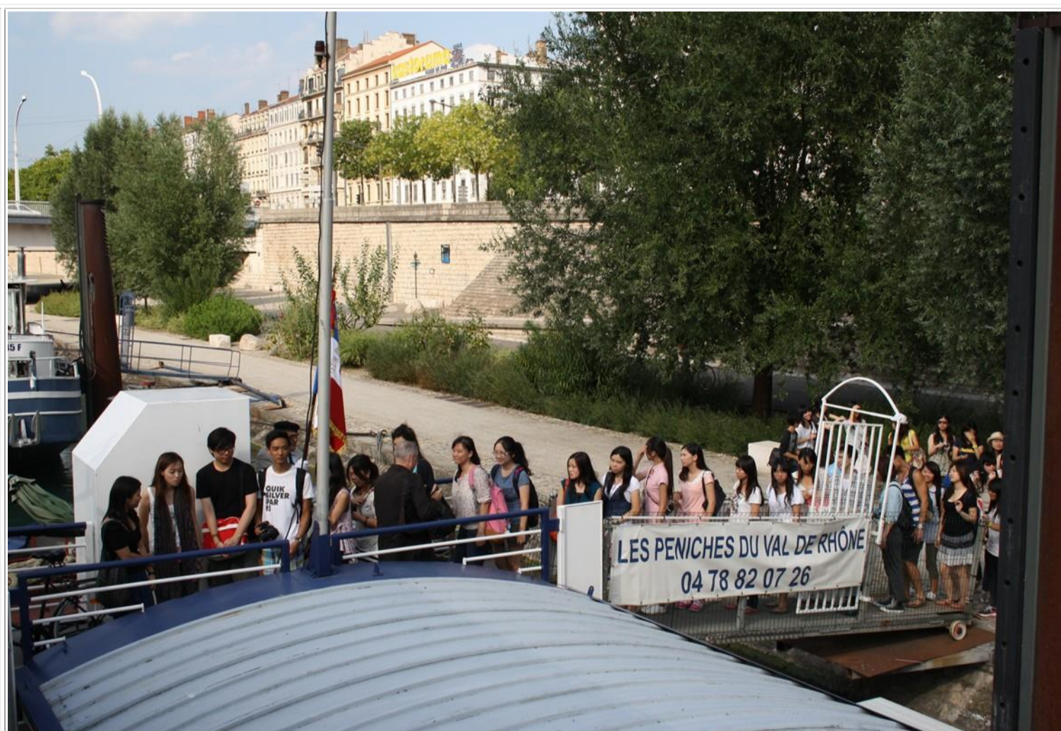
La délégation arrive