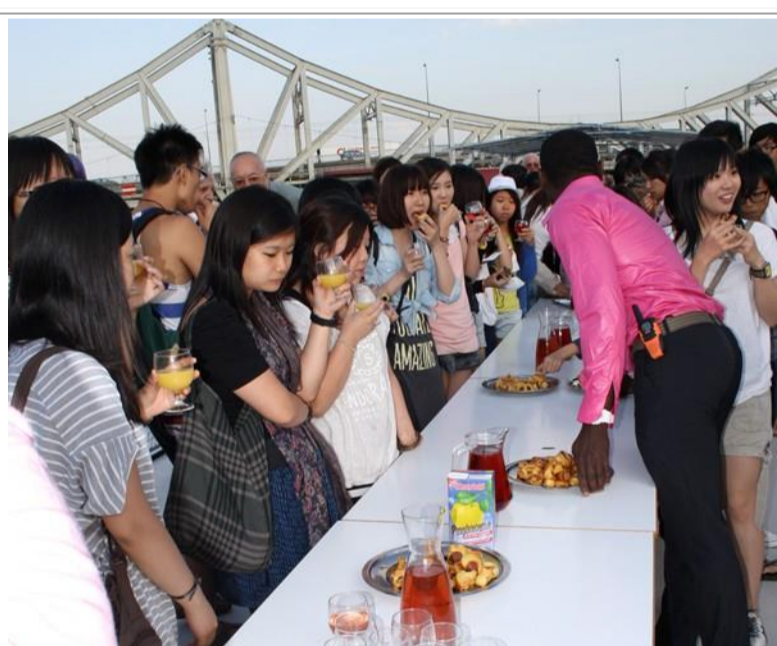
Le buffet vient d'ouvrir