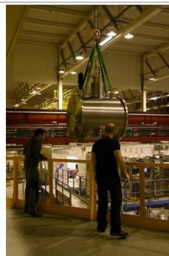
De la grosse mécanique pour observer l'infiniment petit