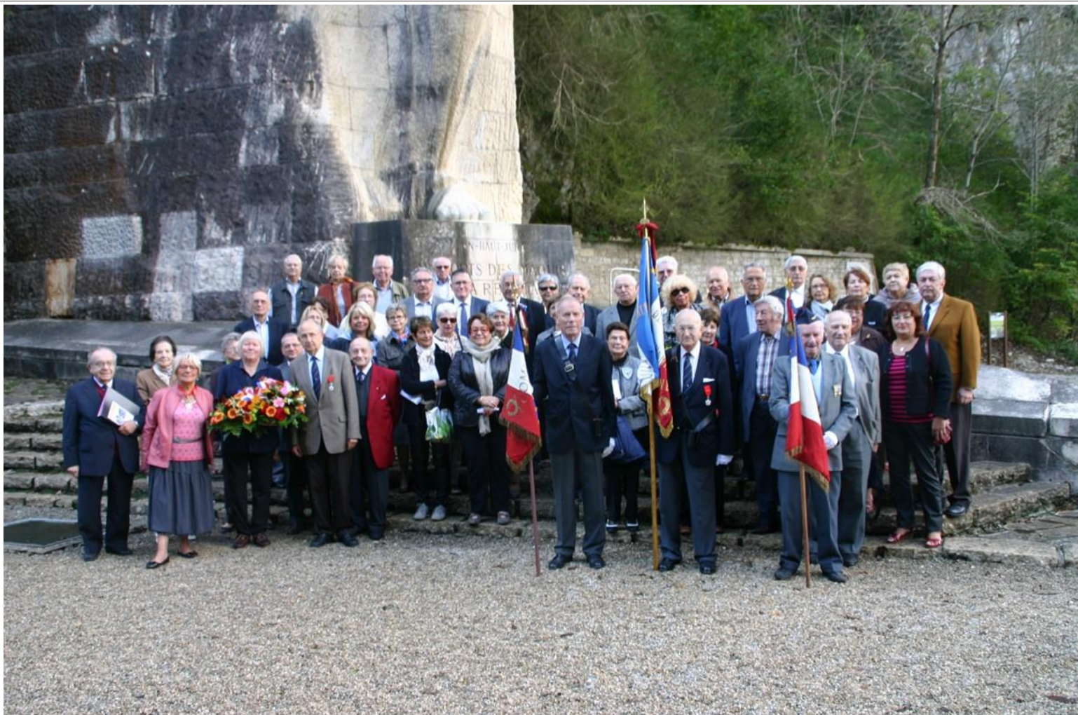
Le groupe et les drapeaux devant le monument