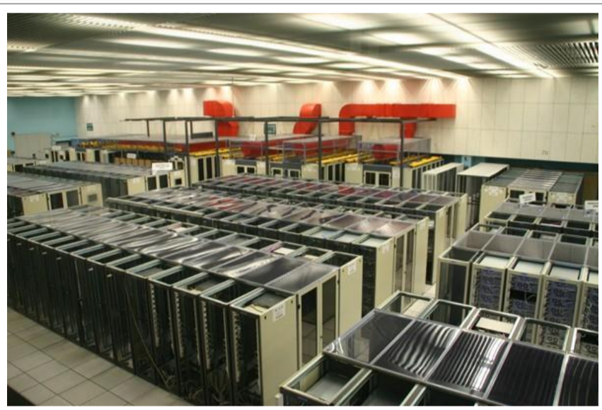
Des puissances de calcul phénoménales