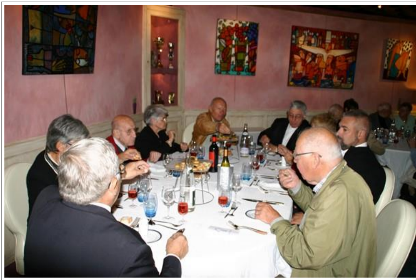
Après un repas au restaurant "Le Pirate" à Ferney, nous traversons la ville pour saluer la statue de Voltaire, avant de nous rendre au CERN, contrainte horaire oblige !

L'après-midi nous transporte dans « l'univers des particules » du CERN (Conseil européen pour la Recherche nucléaire). Avec son anneau souterrain, lieu du plus grand collisionneur au monde de « hadrons » (microparticules élémentaires de la matière). Et sous la conduite de spécialistes nous comprenons comment on décrypte les mystères de la matière du Big Bang à l'Univers.