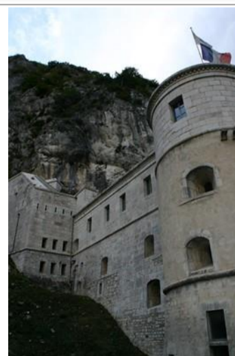
Avant de retourner sur Lyon, nous sommes passés par la Cluse du Rhône avec « fort de l'écluse » dont la prise, il y a 200 ans, précipita la chute de l'empire