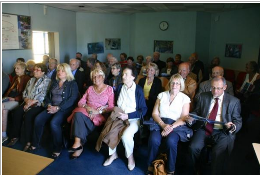
Un public attentif et passionné par la conférence

L'après-midi nous transporte dans « l'univers des particules » du CERN (Conseil européen pour la Recherche nucléaire). Avec son anneau souterrain, lieu du plus grand collisionneur au monde de « hadrons » (microparticules élémentaires de la matière). Et sous la conduite de spécialistes nous comprenons comment on décrypte les mystères de la matière du Big Bang à l'Univers.