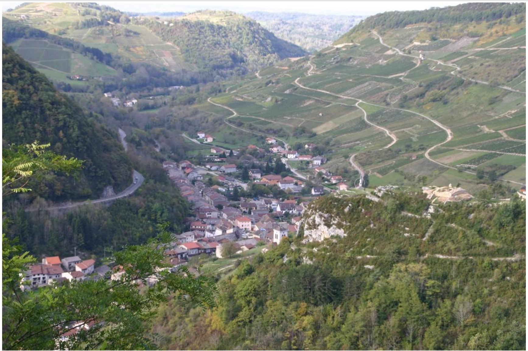
Arrêt panoramique dans la montée de Cerdon sur les coteaux du « bas Bugey » ou « la vigne pousse tout d'un jet ».