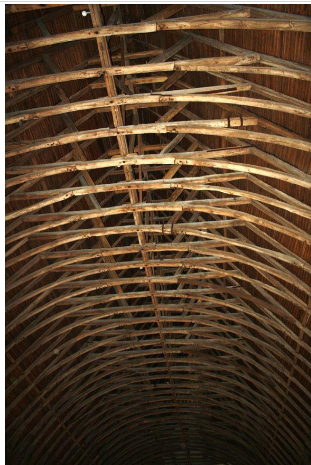
Une bien belle charpente