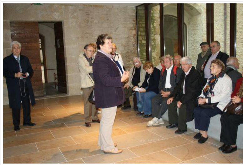
Un petit peu de repos