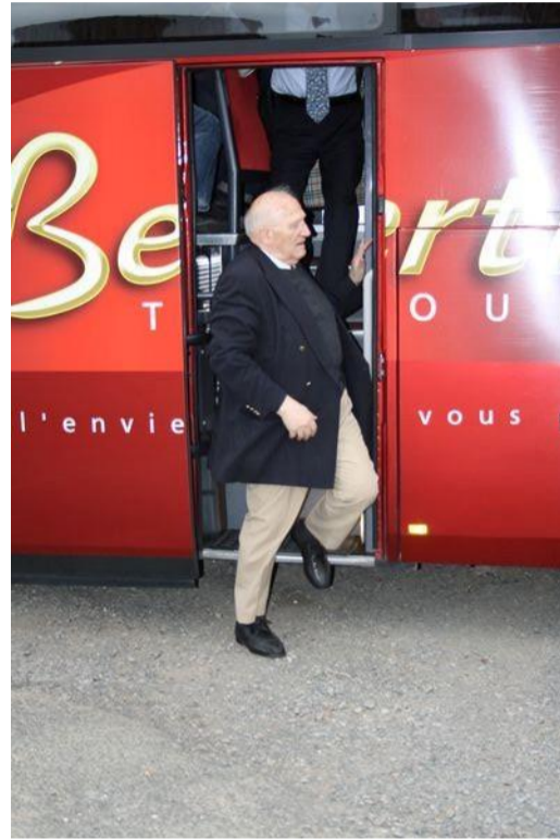
Une dégustation nous attend !