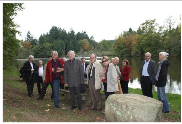
Le groupe devant l'étang