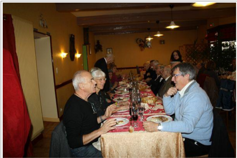
Un peu de réconfort