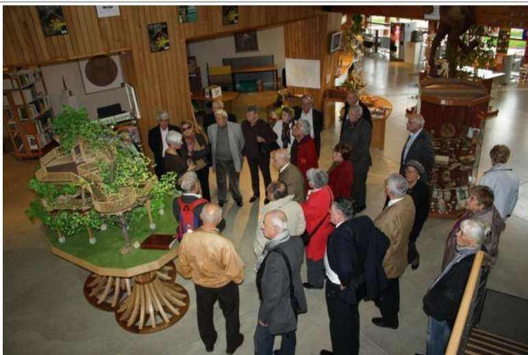
Galerie Européenne de la Forêt et du Bois