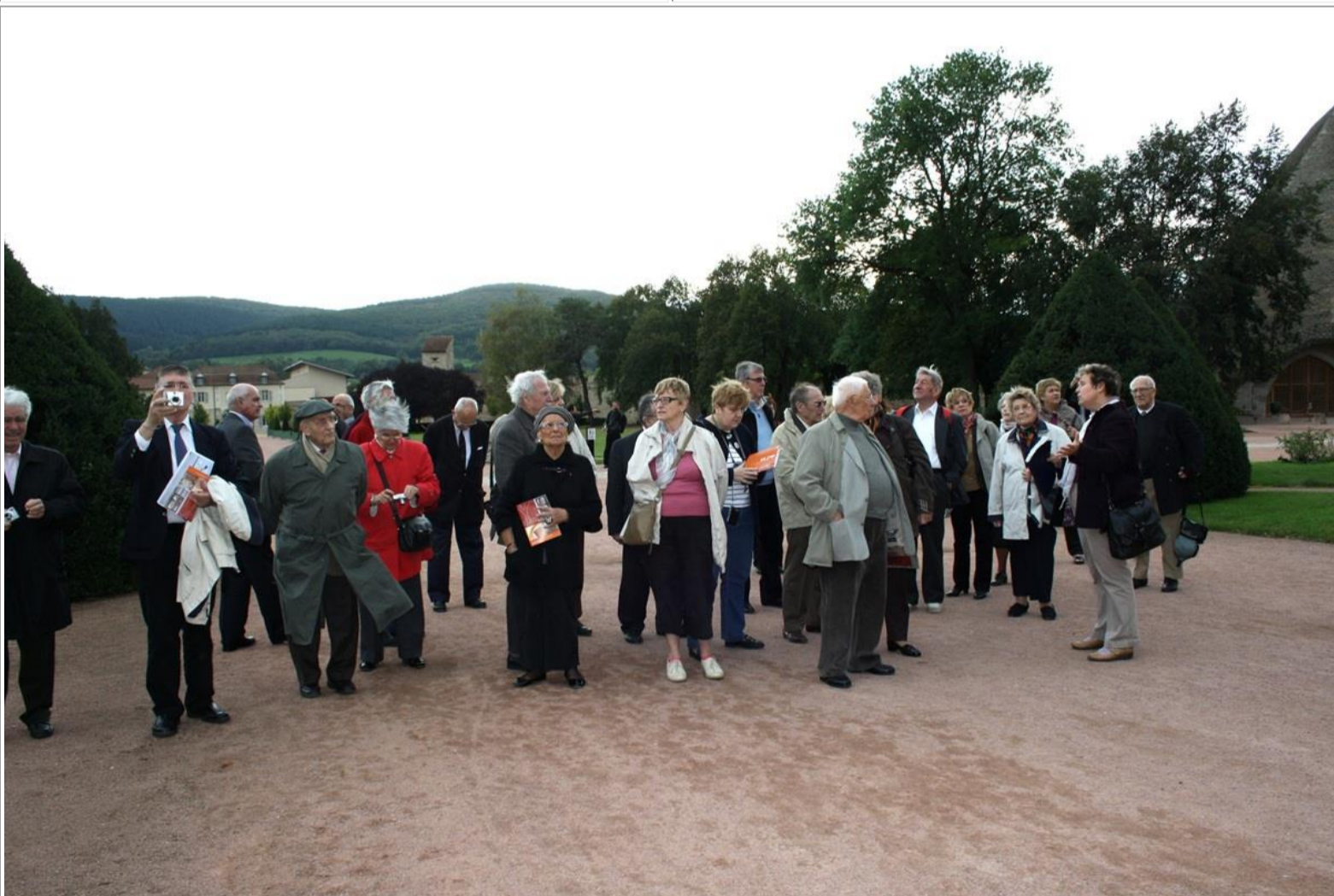
Le groupe admire la façade du cloître