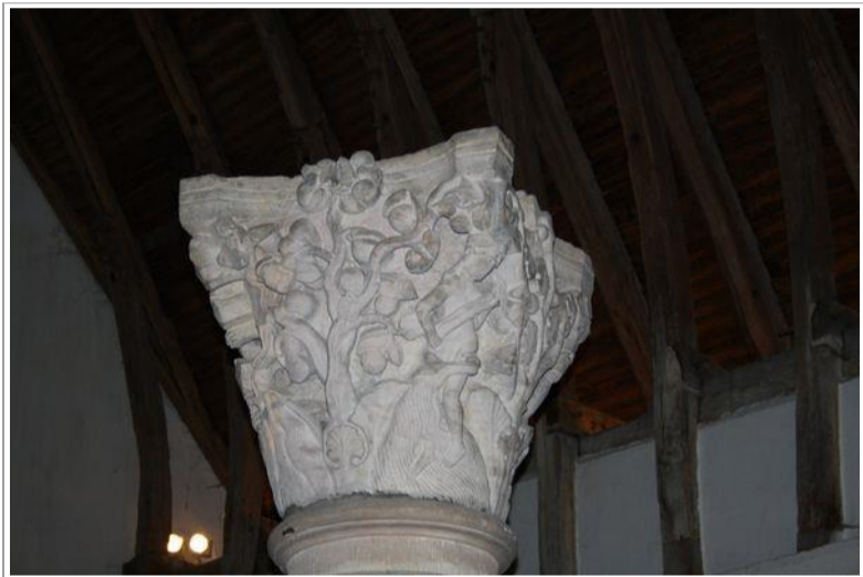
Quelques chapiteaux retrouvés dans les ruines