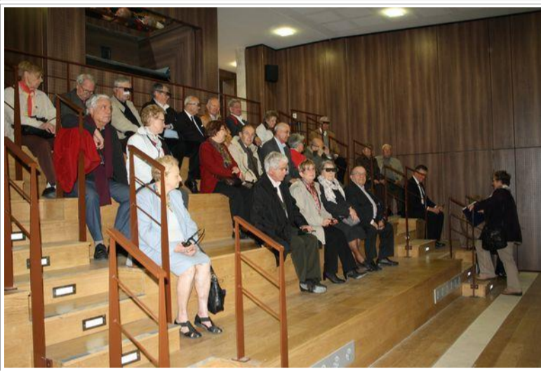
Une séance de cinéma en 3D