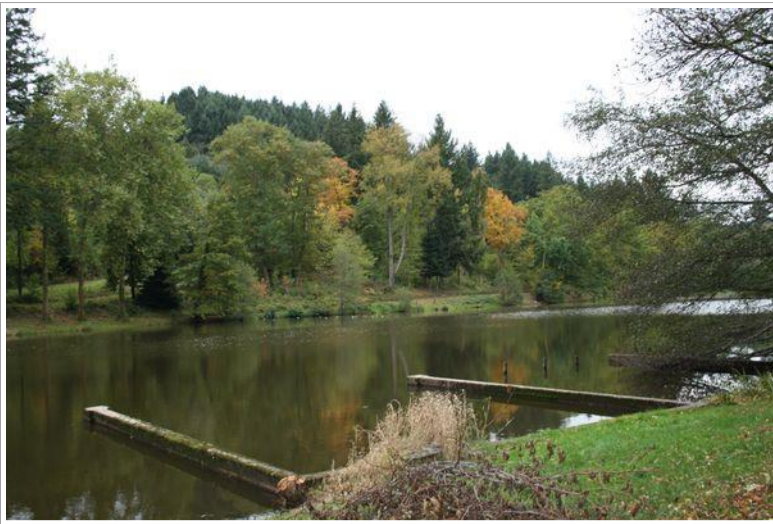
L'Arboretum domanial de Pézanin