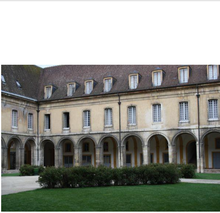
L'intérieur du cloître