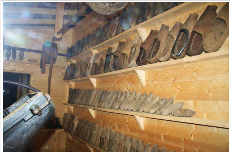
Un choix de sabots