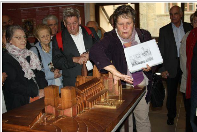
Notre guide nous accueille et nous présente la maquette