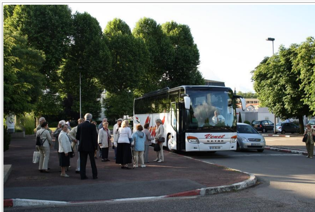
Départ de Lyon

Départ Quartier Général Frère à 8h00 par l'autoroute, direction Isle d'Abeau, Bourgoin Jallieu, Saint Genix sur Guiers, puis Chanaz.