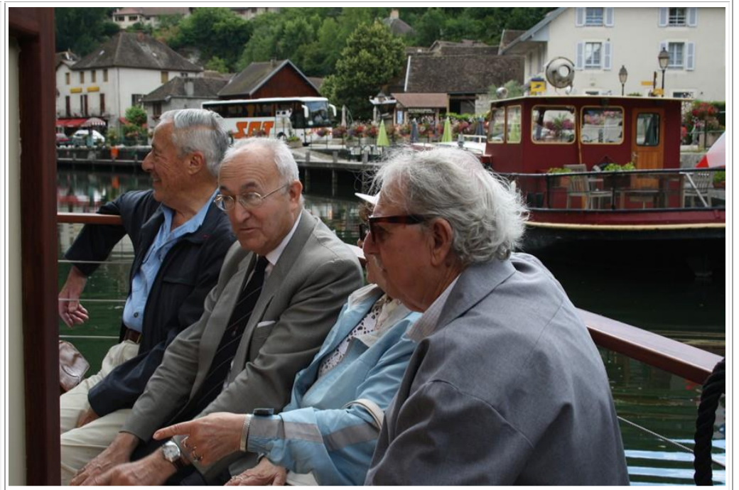
D'autres profitent des embruns