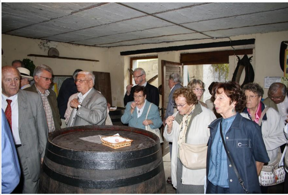
Enfin quelque chose à se mettre sous la dent