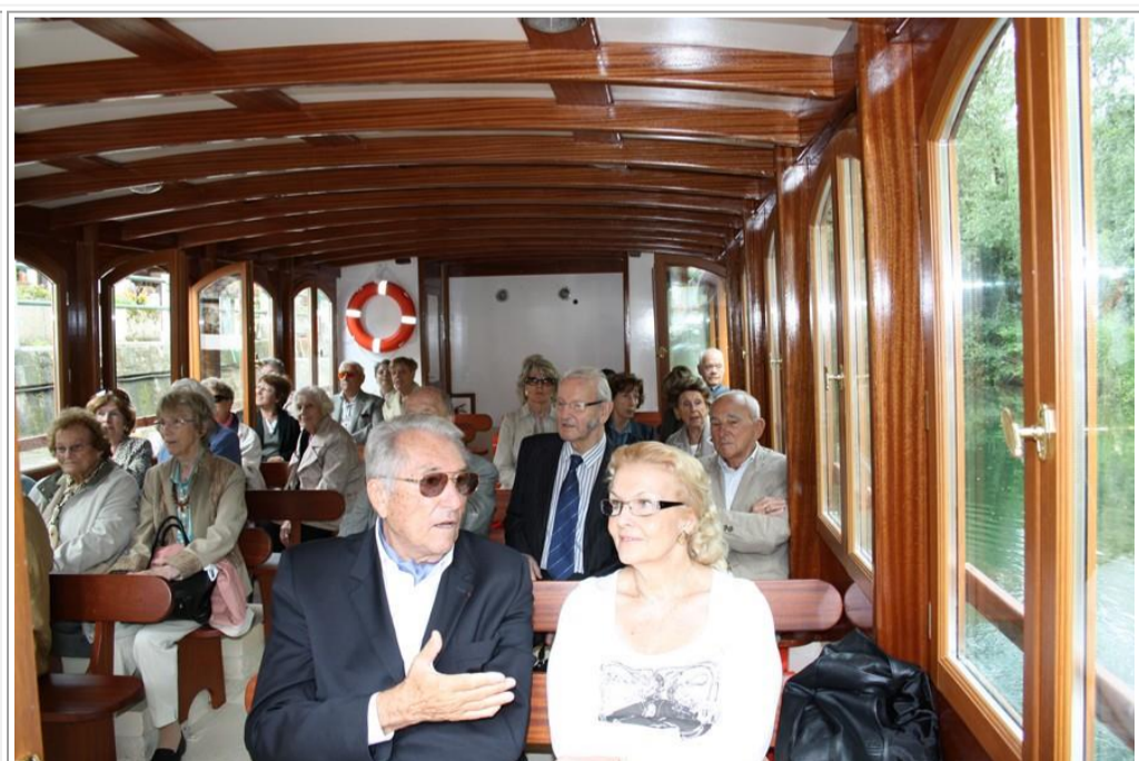
Certains préfèrent la cabine