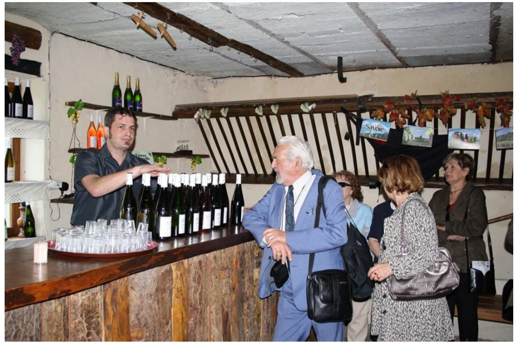
Vous ne partirez pas tant que toutes les bouteilles ne seront pas vides