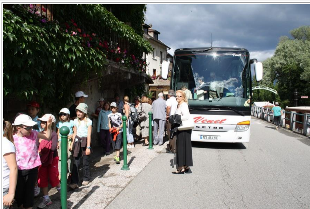
Arrivée à Chanaz

Incroyable mais vrai, nous n'avons pas encore goûté le Kario, que ses effets de rajeunissement se font déjà sentir