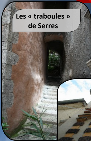
Les « traboules » de Serres

Notre premier arrêt se fait à Serres la moyenâgeuse