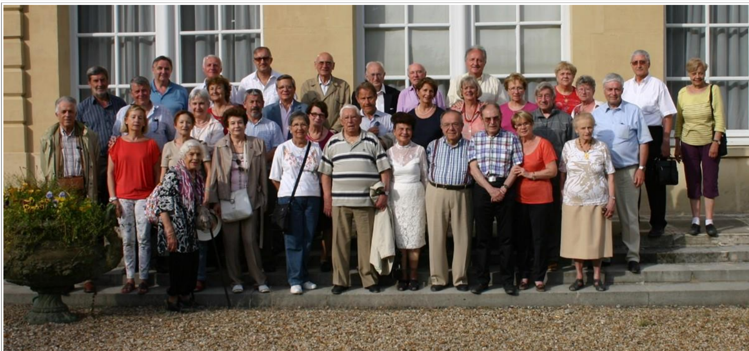
Le groupe « des 39 » de la Section « 69 » sur le perron du château du Val