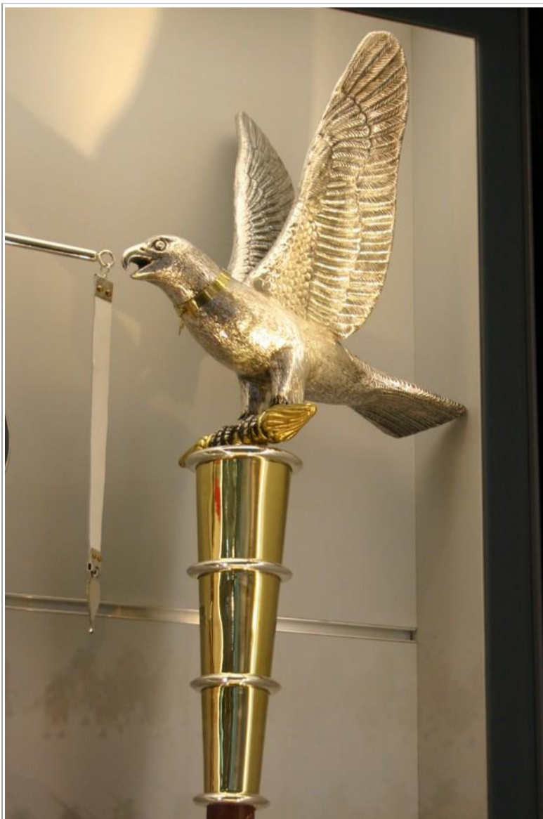
Une restitution des emblèmes des cohortes