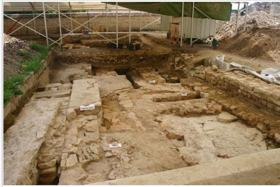
Les fouilles actuelles dans la cour du cloître adjacent