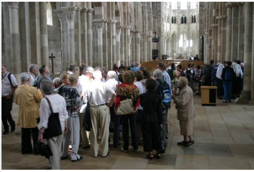
Les lyonnais très attentifs aux explications de la sœur compétente tant en architecture qu'en histoire chrétienne