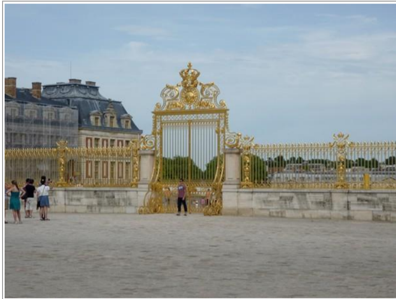
La grille principale d'entrée du Château éclatante d'or