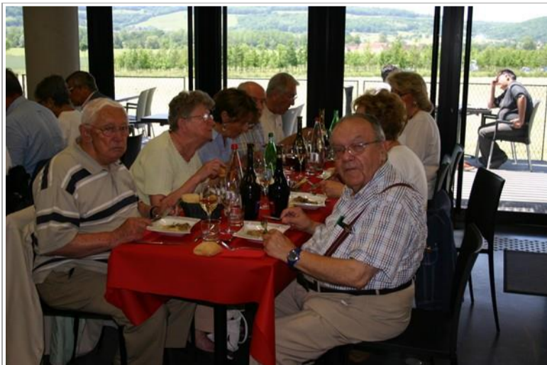
Un repas gastronomique et convivial avec toujours une « unité de lieu » très appréciable