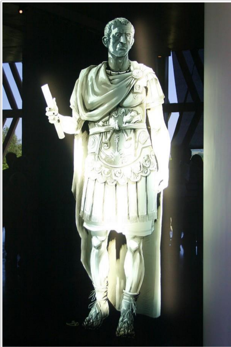
Statues ou visualisations 3D comme ici les deux « chefs » Vercingétorix et Jules César