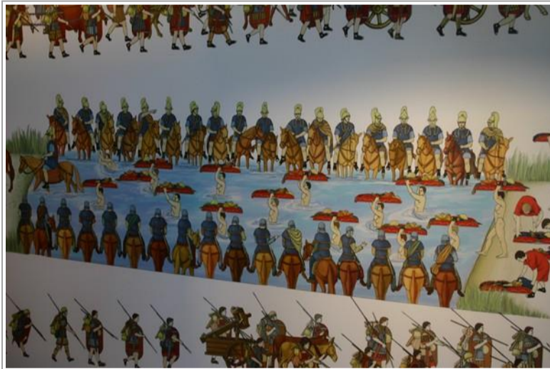
Des panneaux en perspective pour visualiser l'ordonnancement des troupes en déplacement : ici les troupes romaines