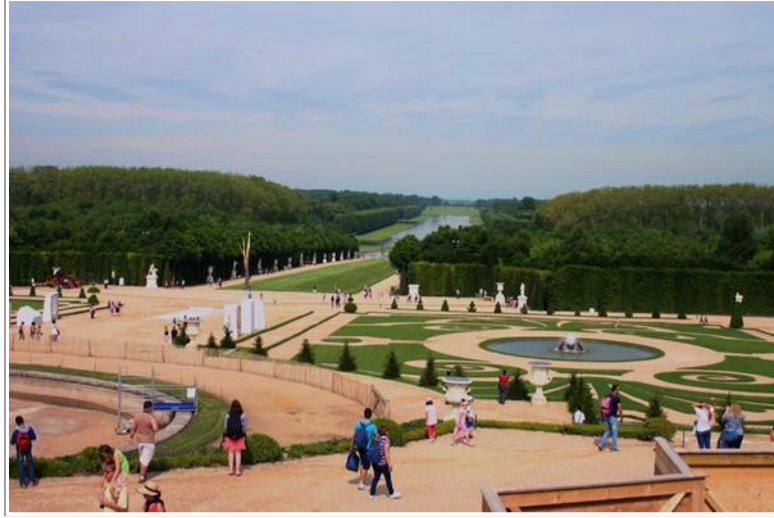
Vue panoramique des jardins de Le Nôtre