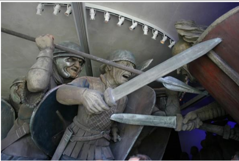
Une reconstitution en maquette à l'échelle 2 d'un corps à corps des fantassins romains et gaulois