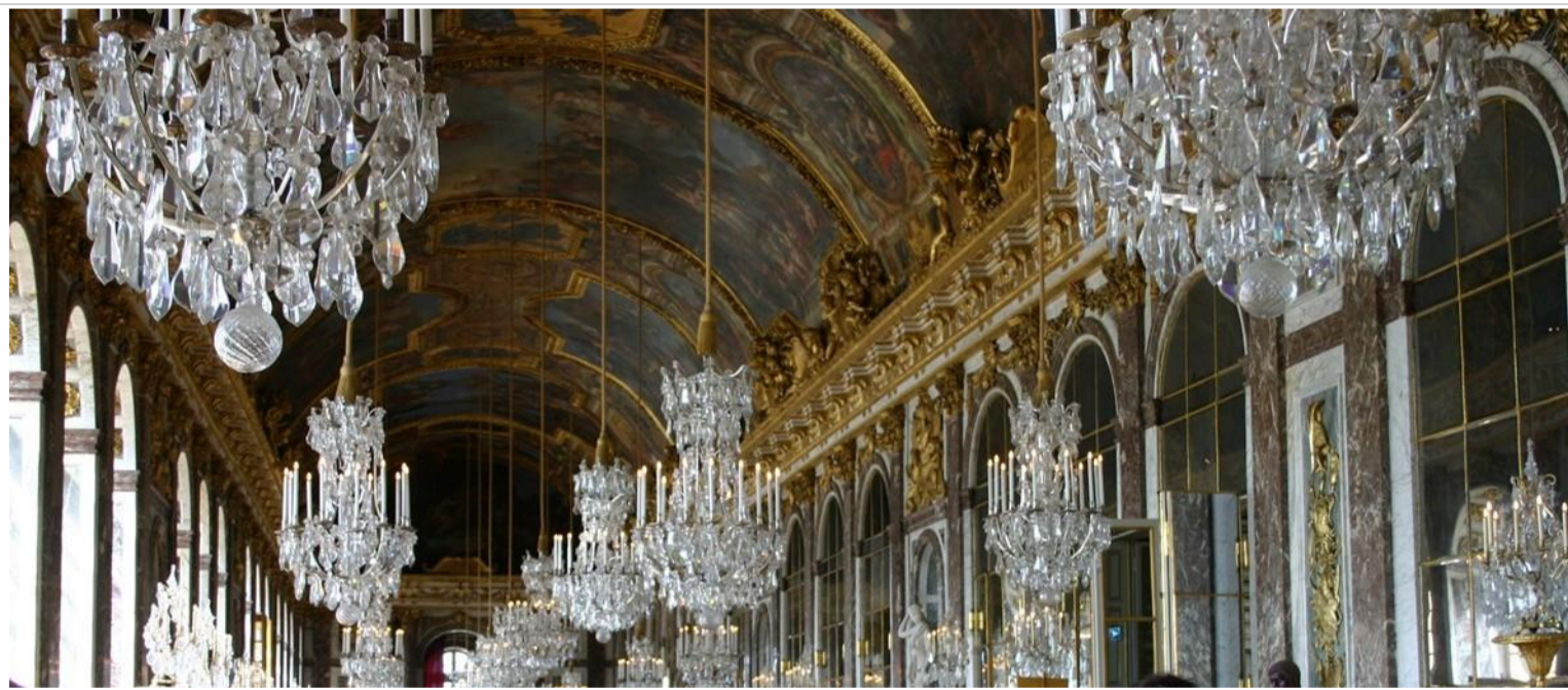
Le plafond et l'enfilade des lustres de ... la galerie des glaces