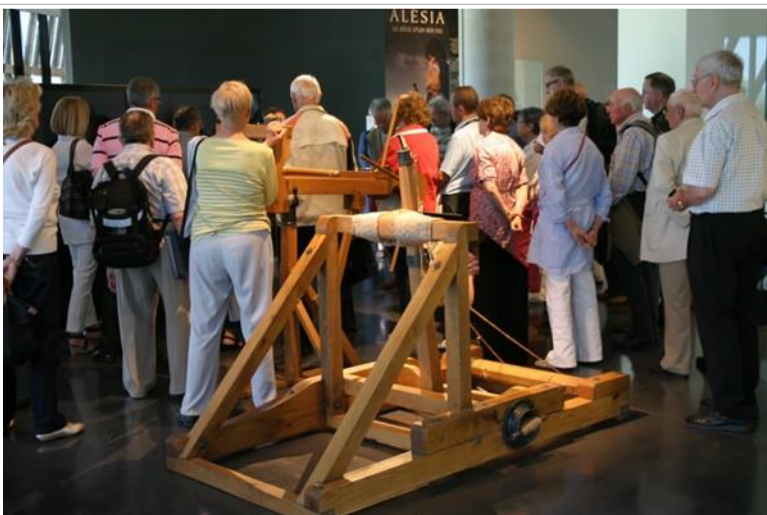
Une visite guidée par une guide « historienne » très captivante