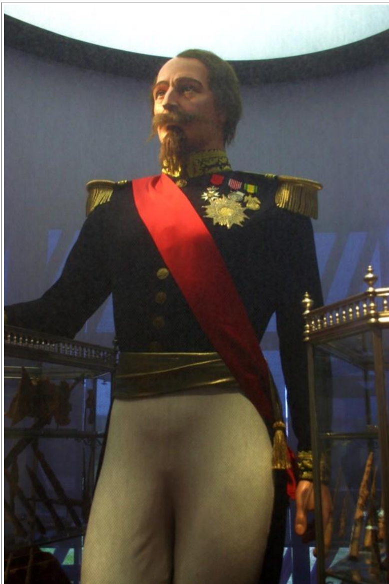
Napoléon III qui a beaucoup contribué à faire connaître le site et évoluer les connaissances historiques