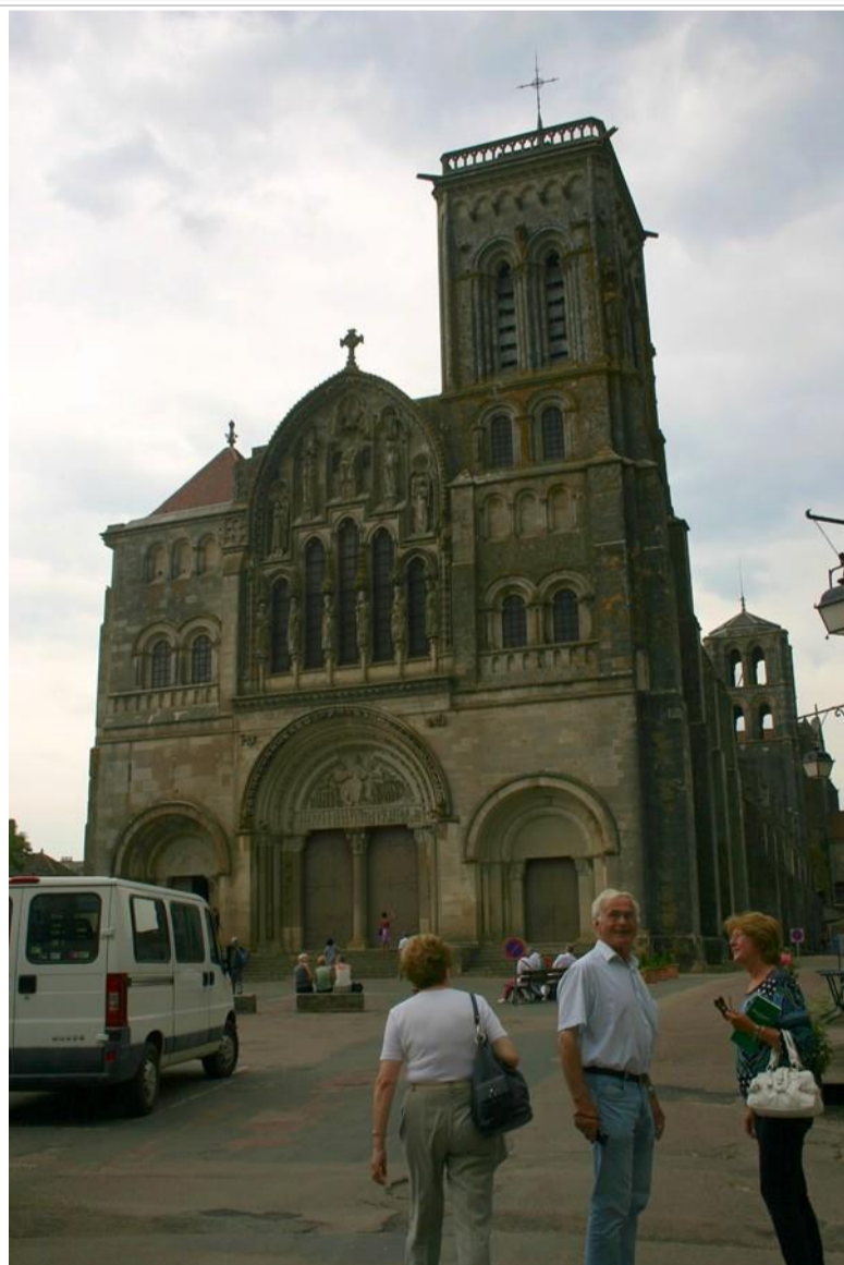
La façade XIIIème de la basilique romane se Sainte-Marie-Madeleine de Vézelay