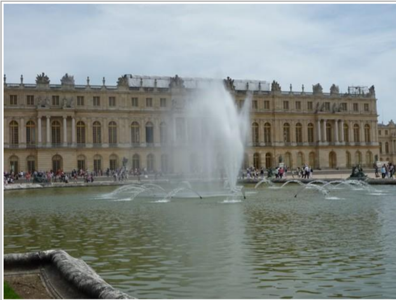
Un peu de la féerie des fontaines de Versailles... sans la musique