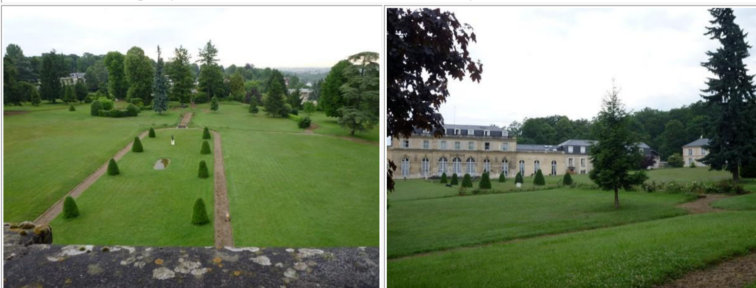
Les jardins et la belle architecture de « notre » maison »