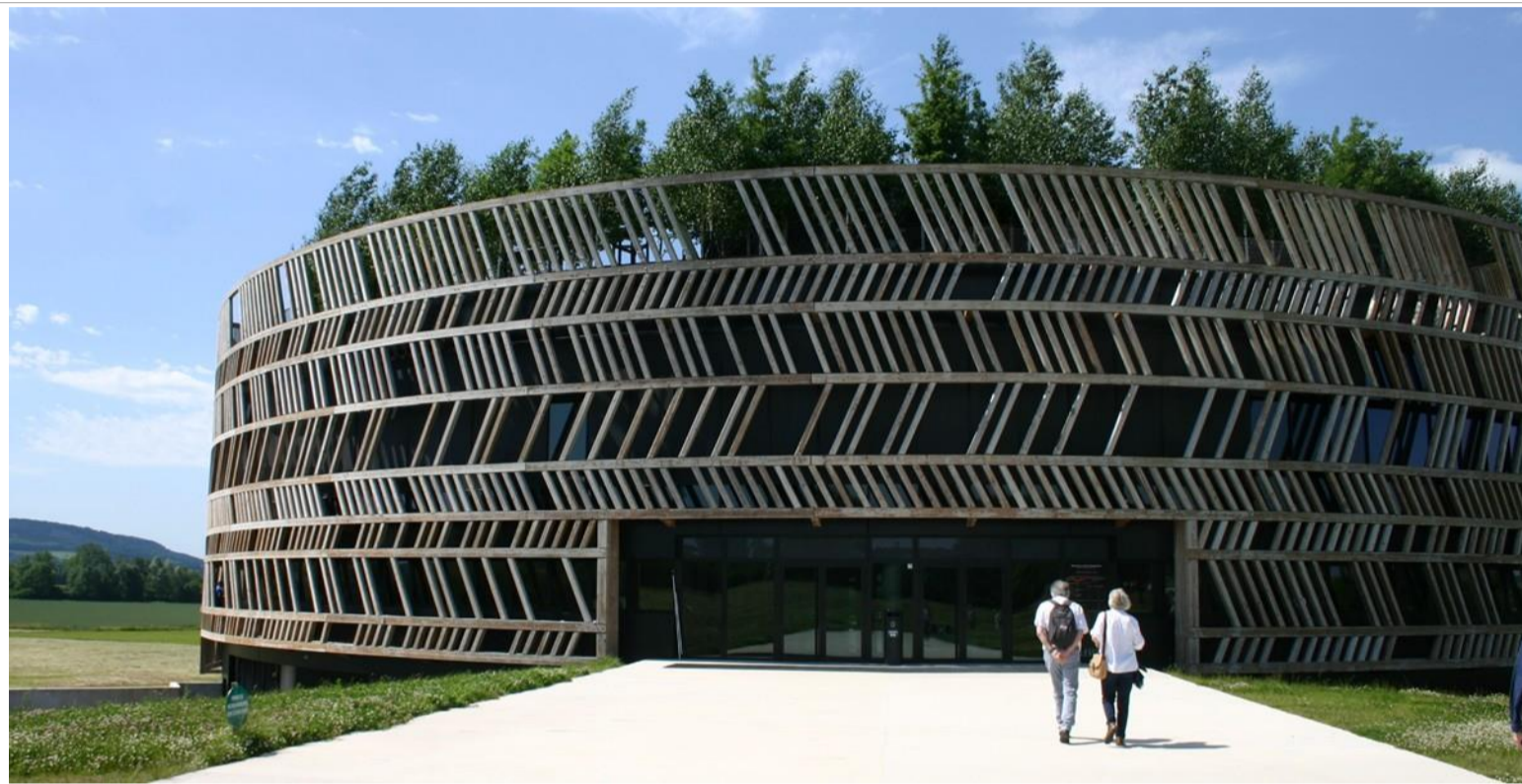
Museoparc d'Alesia : une réalisation moderne, bien intégrée au site et utilisant toutes les techniques muséologiques pour reconstituer la bataille d'Alesia.