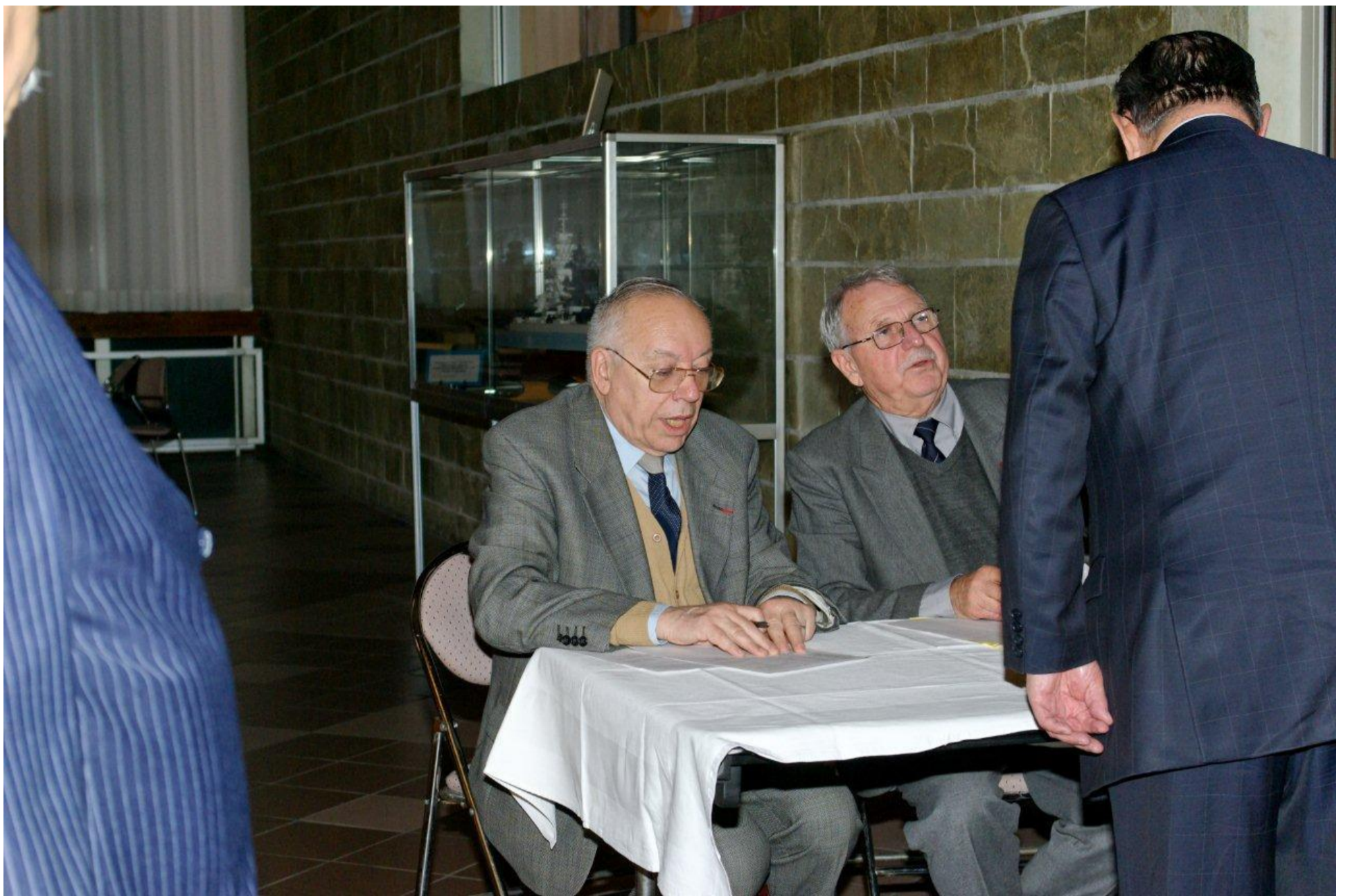
Le comité d'accueil des sociétaires