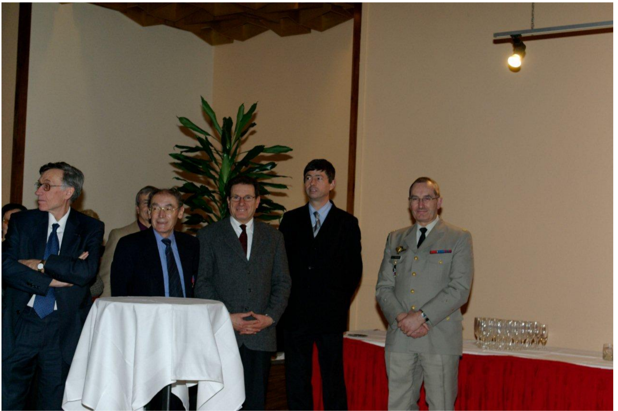
...une assistance nombreuse et de qualité.