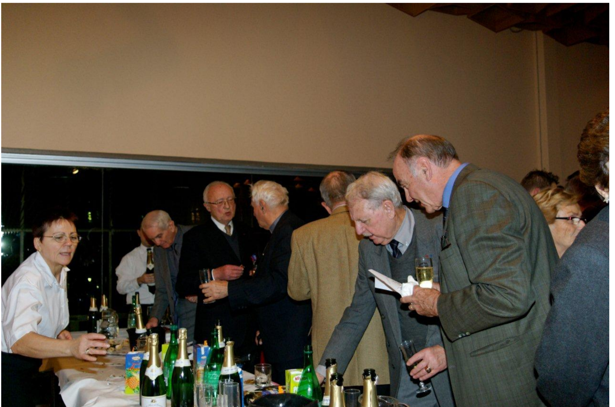
Après l'effort, le réconfort