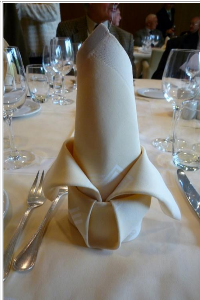
Si vous voulez essayer à la maison !

Notre Président remercia tous les présents ...mais retint tous les membres du bureau du Comité 10 pour la réunion mensuelle.