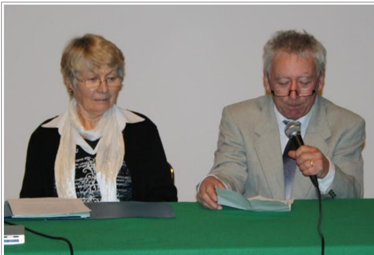
L'accueil est assuré par les représentants de l'académie.