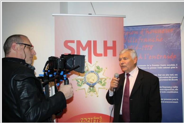
Le président de la Section de l'Ain et Le président du comité 15