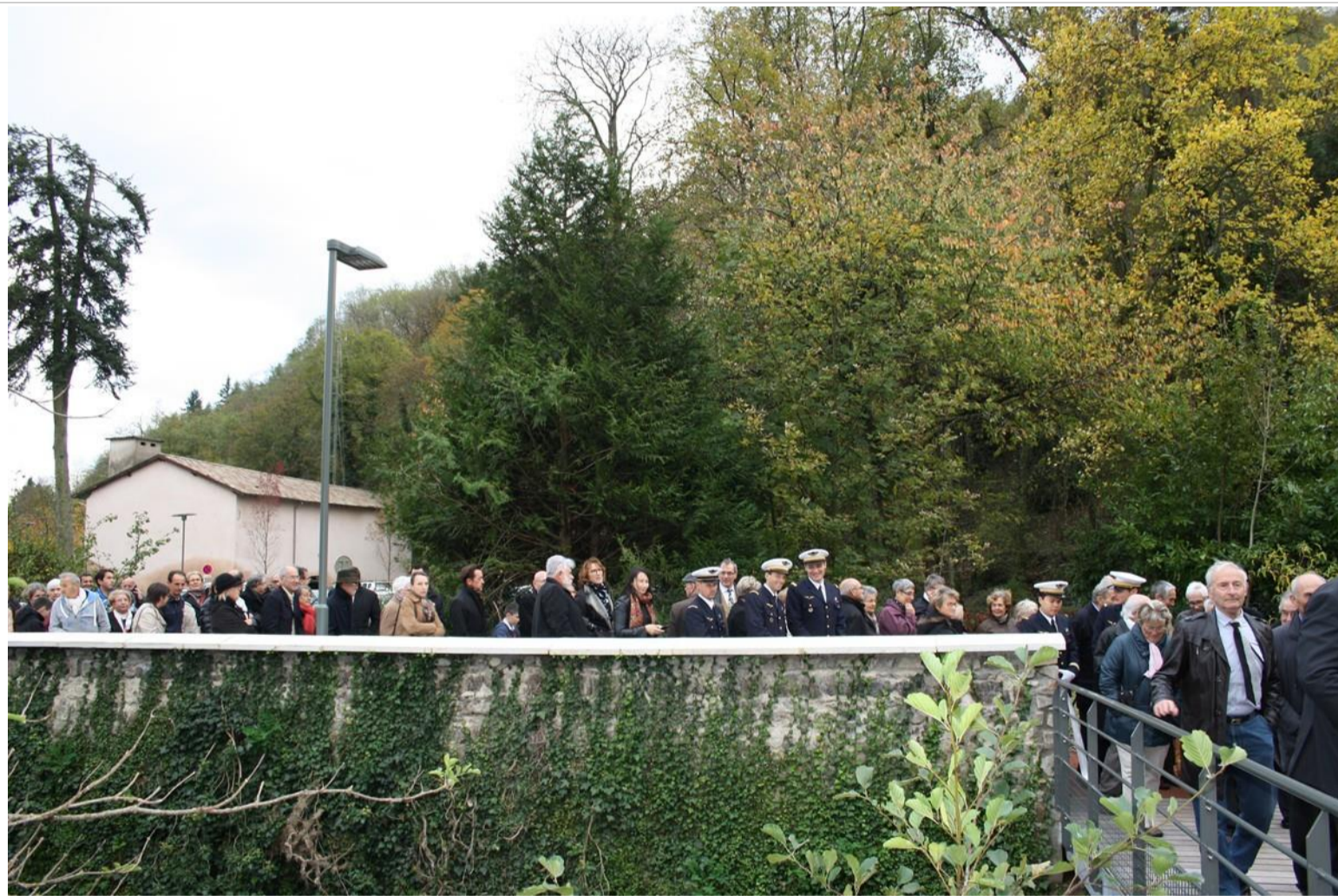
La voie est libre, la population peut accéder au passage.