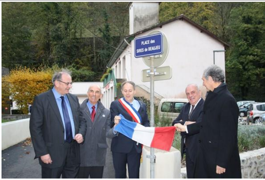
La plaque de la place des Sires de Beaujeu dévoilée