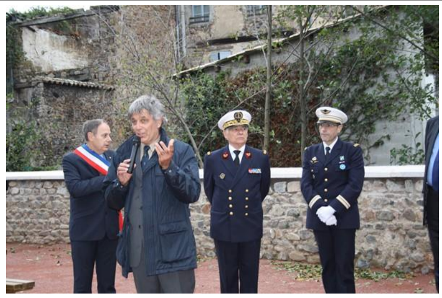
Discours du président des Vieilles tiges Antoine de SAINT EXUPERY Régions AUVERGNE BOURGOGNE RHONE-ALPES