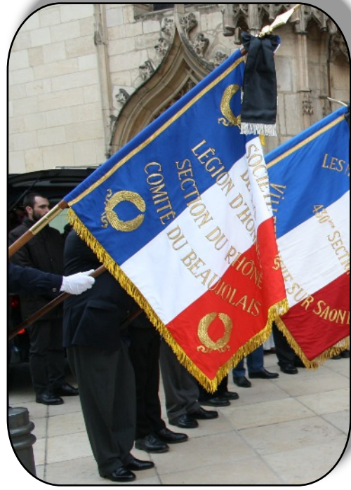
Le nouveau drapeau du comité Villefranche Beaujolais