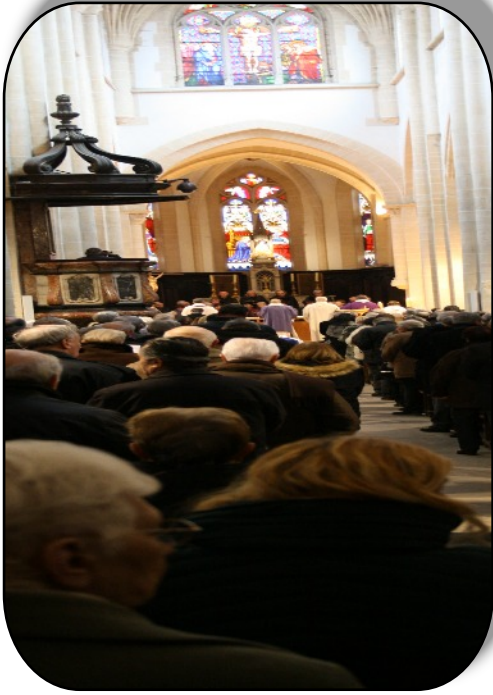
Plus une place disponible dans la Collégiale