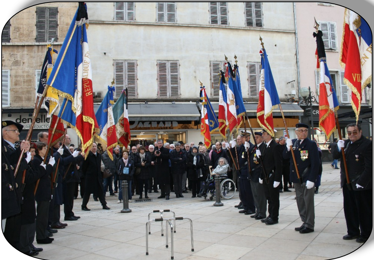
La haie d'honneur des drapeaux à la sortie de la Collégiale