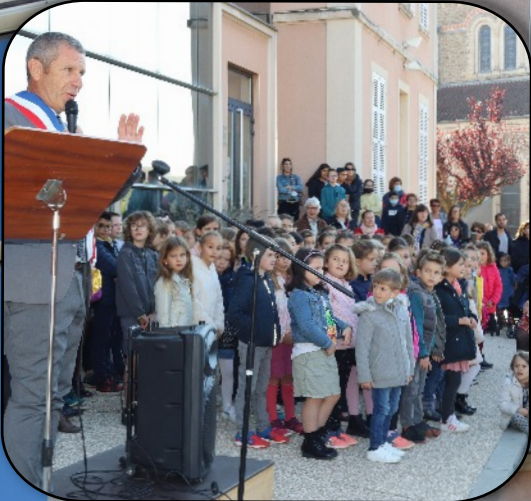
Les enfants des écoles