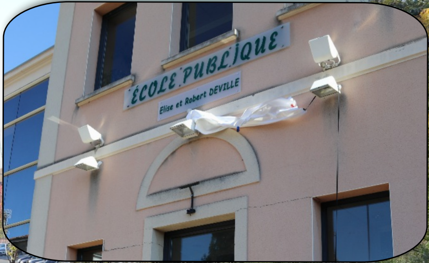
Dévoilement de la plaque