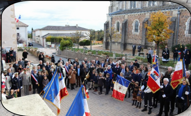
Les nombreuses personnes venues rendre hommage au Capitaine Etienne d'Hotelans