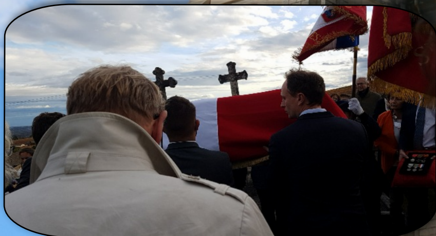
L'arrivée du cercueil au cimetière