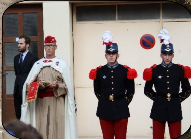
Le Clairon et deux représentants de l'École spéciale militaire de Saint-Cyr