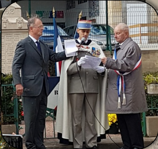
Allocution d'un membre de la famille