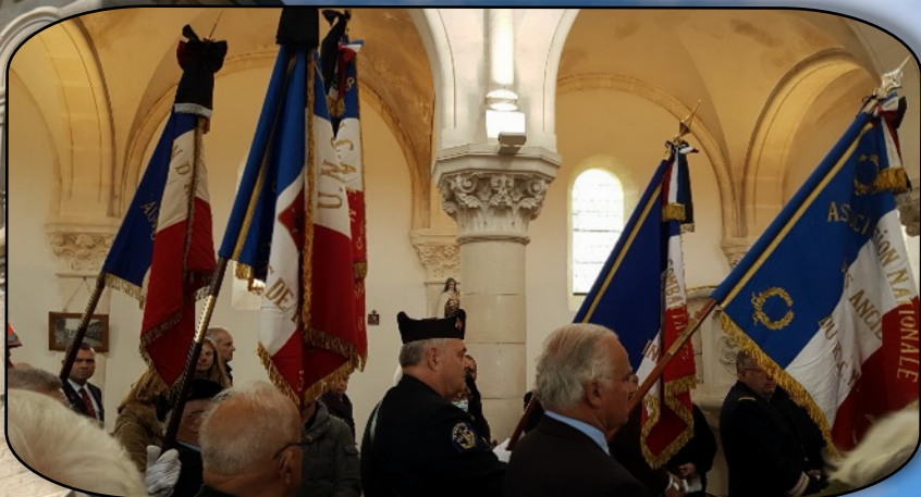
Suivi par les drapeaux