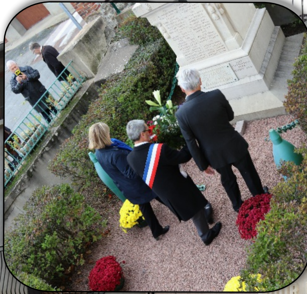
Dépôt de gerbe