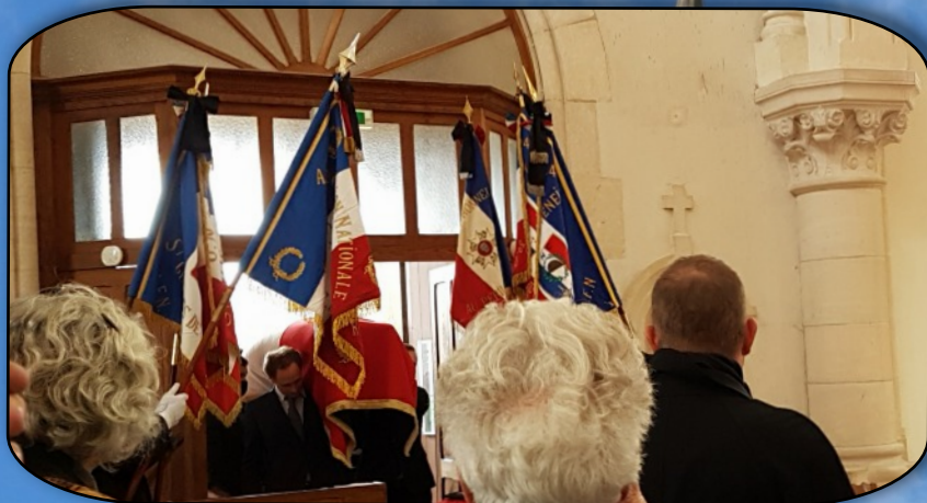
L'entrée du cercueil dans l'église