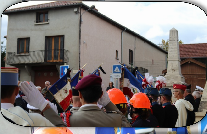
Le drapeau des DPLV