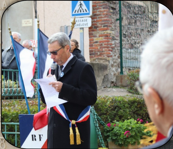
Allocution de Monsieur le Maire de Chénas