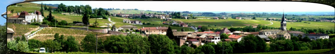
Le capitaine pourra maintenant profiter du magnifique paysage.