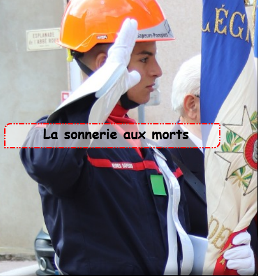
La sonnerie aux morts